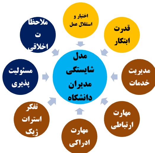
شکل ۱. مدل مفهومی شایستگی مدیران دانشگاه علوم پزشکی

براین اساس وبا توجه به نتایج بدست آمده در مورد پاسخگویی به سوال اول تحقیق که عبارت بود از اینکه مولفه های مدل شایستگی مدیران دانشگاه های علوم پزشکی کدامند، می توان گفت مدل مفهومی شایستگی مدیران دانشگاه عبارتند از هشت مولفه که در شکل زیر آمده است.