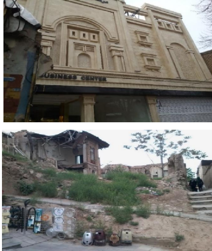
تصویر ۱. دوگانگی بافت‌های فرسوده و نوساز بافت

مرکزی به کندی پیش رود. و همین موضوع خود باعث فرسودگی و دوگانگی بیشتری شود (تصویر ۱).