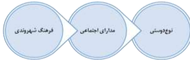
شکل ۴: هنجایشات تبلیغات در رویارویی با فرهنگ شهروندی- (نگارندگان، ۱۴۰۳)