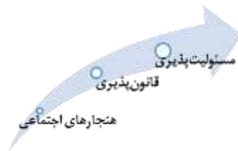
شکل ۲: مسیر تقویت در ارتباط با هنجارهای اجتماعی و مسئولیت‌پذیری- (نگارندگان، ۱۴۰۳)

تبلیغات شهری تأثیر قابل توجهی در تقویت هنجارهای اجتماعی دارد. به مثابه رعایت قوانین و مقررات، رفتارهای مناسب و احترام به حقوق دیگران، از جمله مواردی هستند که در تبلیغات شهری به‌طور غیرمستقیم ترویج می‌شوند. تیزرهای تبلیغاتی شهرداری، با به‌تصویر کشیدن پیام‌هایی در خصوص رعایت قوانین، نقش مؤثری در فرهنگ‌سازی برای رفتارهای قانون‌مند در جامعه ایفاء می‌کنند. این امر به افزایش قانون‌پذیری شهروندان کمک کرده و سطح انضباط اجتماعی را ارتقاء می‌دهد. علاوه بر این، تبلیغات شهری به مسئولیت‌پذیری شهروندان کمک می‌کند. شهروندانی که مکرراً در معرض این تبلیغات قرار می‌گیرند، بیشتر از قبل احساس مسئولیت نسبت به محیط زندگی و جامعه خود دارند. این احساس مسئولیت شامل: موضوعاتی به‌مانند حفظ پاکیزگی شهر، پرداخت به‌موقع عوارض شهری و مشارکت در برنامه‌های عمومی می‌شود. در مجموع، تبلیغات شهری می‌تواند به شکل‌گیری یک فرهنگ مسئولیت‌پذیری در میان شهروندان منجر شود. فرایند این مرور برپایه (شکل ۲).