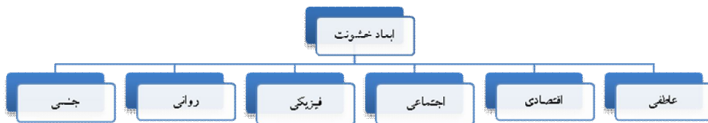
شکل شماره (۲): ابعاد خشونت

روش تحقیق به لحاظ هدف کاربردی پیمایشی می‌باشد. جامعه آماری این پژوهش زنان متأهل شهرستان خلخال می‌باشند. تعداد زنان متأهل براساس آمار امور زنان فرمانداری خلخال ۱۵۰۰۴ نفر می‌باشد که با استفاده از فرمول کوکران ۳۱۸ نفر به عنوان حجم نمونه انتخاب گردید. برای این که تمام جمعیت آماری شانس برابر جهت انتخاب شدن در نمونه داشته باشند از روش نمونه گیری خوشه‌ای به شیوه تصادفی ساده استفاده شده است. بر اساس روش خوشه‌ای تصادفی شهر به چهار منطقه تقسیم شده است و هر منطقه به بیست بلوک تقسیم گردید و از هر بلوک افراد مورد نظر انتخاب گردیدند. ابزار گردآوری اطلاعات پرسشنامه می‌باشد. پایایی پرسشنامه با استفاده از آلفای کرون باخ انجام گرفت که در شاخص های مختلف پایایی بالای ۰/۸۰ گزارش شده است و نشان می‌دهد پرسشنامه از پایایی مناسبی برخوردار است. خشونت به یک شکل و یک شیوه اجرا نمی‌شود. شیوه‌های مختلفی برای خشونت ورزی علیه زنان وجود دارد این مفهوم ابعاد مختلفی دارد با توجه مباحث ارائه شده در بخش نظری و با توجه به پیشینه تحقیقات انجام گرفته، ابعاد زیر برای خشونت در نظر گرفته شده است: