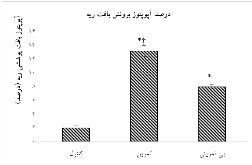
نمودار ۲- میزان تغییرات آپوتوز برونش بافت ریه در گروه‌های پژوهش؛ † تفاوت معنی دار بین گروه‌های تمرین و علامت * نشان دهنده تفاوت معنی دار نسبت به گروه کنترل.