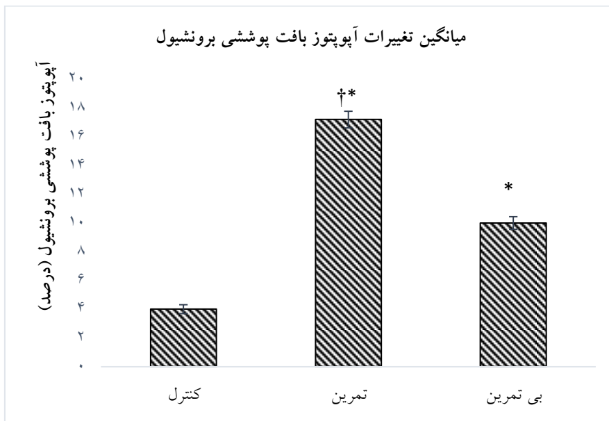
نمودار ۳- میزان تغییرات آپوتوز برونشیول بافت ریه در گروه‌های پژوهش؛ † تفاوت معنی دار بین گروه‌های تمرین و علامت * نشان دهنده تفاوت معنی دار نسبت به گروه کنترل.