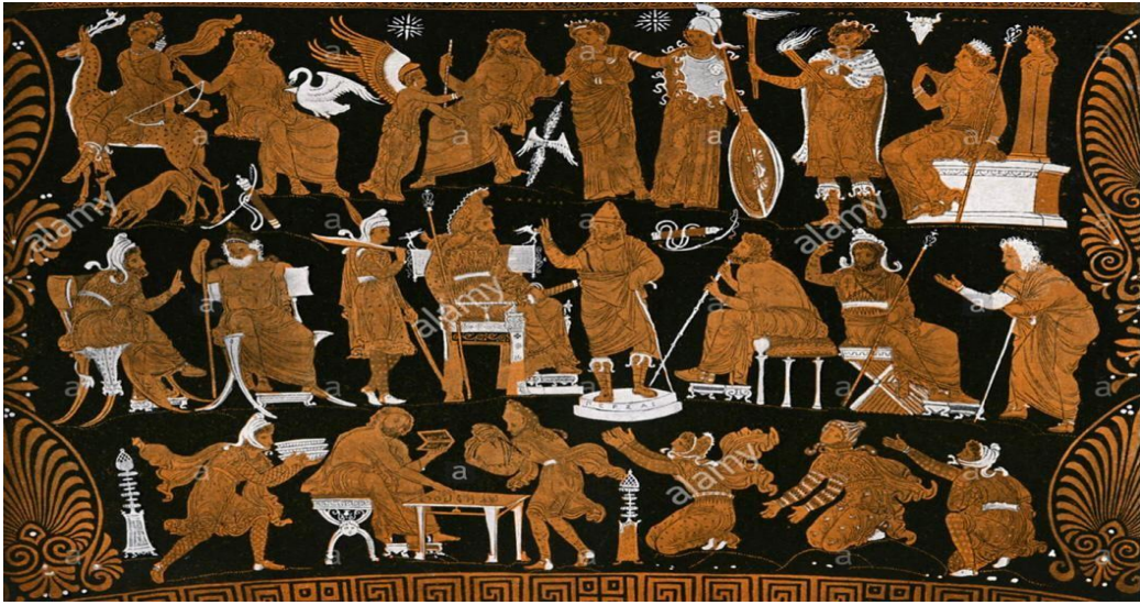
تصویر شماره ۹- دادگاه داریوش، قرن ۵-۶ ق.م