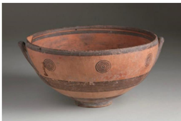
تصویر شماره ۲- کاسه قبرسی، دوره ژئومتریک (۸۵۰-۹۵۰ ق.م) Eisen. 2015: 6