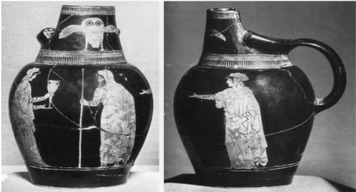
تصویر شماره ۱۱- عزیزمت جنگجوی پارسی، قرن ۵ ق.م، محل نگهداری موزه واتیکان. Musei Vaticani. 16536(H530)