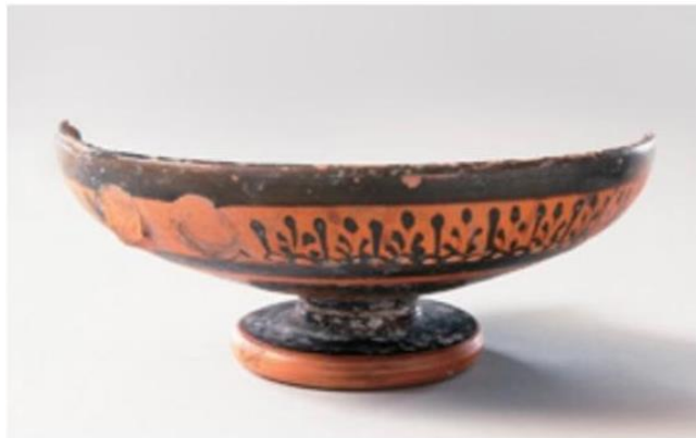
تصویر شماره ۴- لیکتوس، دوره کلاسیک (ربع سوم قرن ۵ ق.م) Eisen. 2015: 7