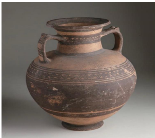
تصویر شماره ۶- آمفورا، عصر برنز متاخر (۱۰۰۰ ق.م) Eisen. 2005: 4