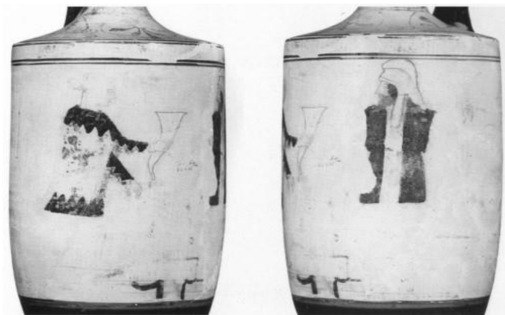
تصویر شماره-۱۳ پارسیان در مقبره، قرن ۵ ق.م، محل نگهداری توپینگن آلمان Tubingen S/10 136