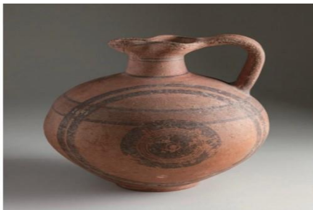
تصویر شماره ۱- اوینوکویه قبرسی، دوره ژئومتریک (۷۵۰-۹۵۰ ق.م) Eisen. 2015: 5