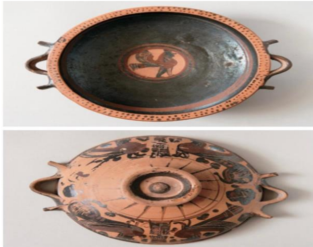
تصویر شماره ۳- لیکانیس، دوره آرکائیک (۵۶۵-۵۷۵ ق.م) Eisen. 2015: 2