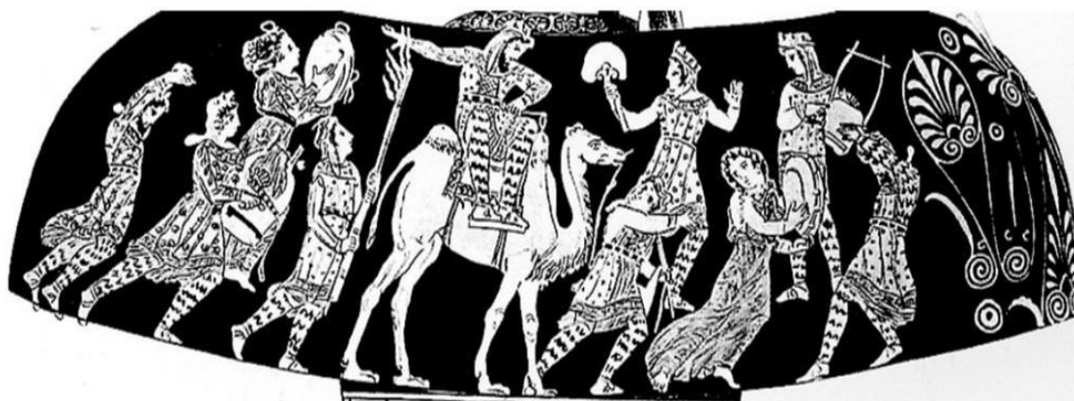
تصویر شماره ۷- شتر لیکتوس، ۳۷۰ ق.م Liewellen-jones. 2011: 31