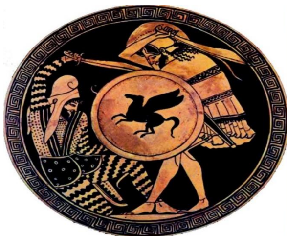
تصویر شماره ۸- کیلیس نبرد یک فرد پارسی و یونانی، قرن ۵ ق.م Kennedy, 2019