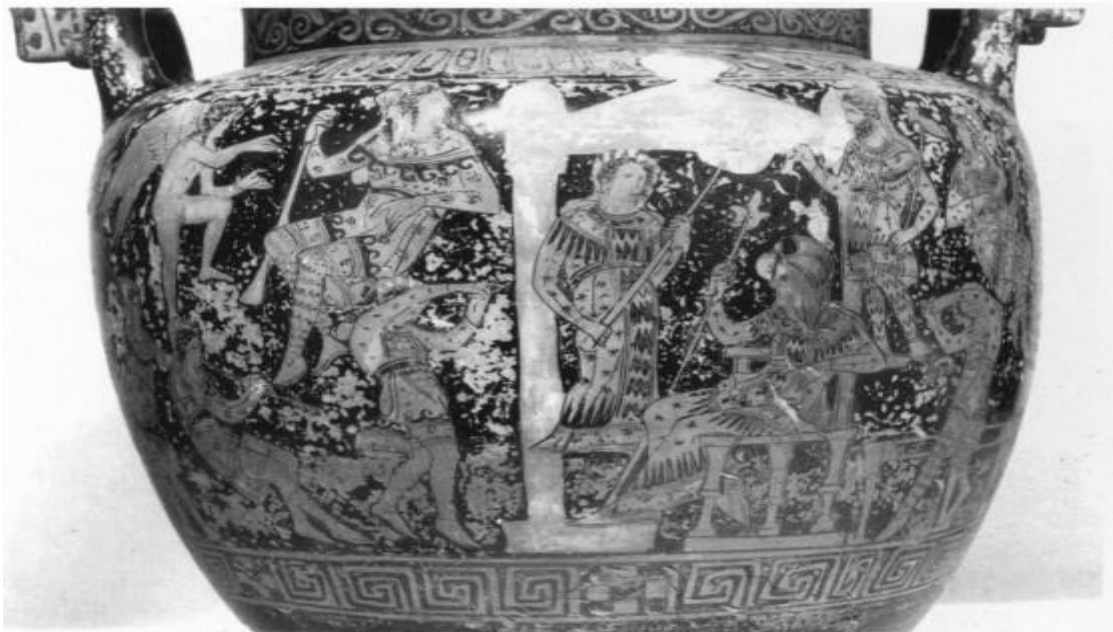
تصویر شماره ۱۲- دادگاه پارسی، قرن ۵ و ۴ ق.م، محل نگهداری موزه وین (Vienna AS IV 158)