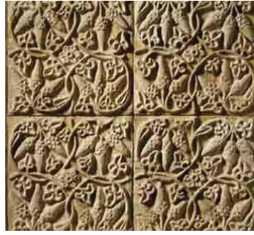
شکل ۱۳- برگ های درهم رفته که در انتهایشان دارای میوه بلوط هستند، کاخ تیسفون، موزه مترو پولیتن