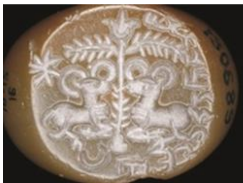
شکل ۹- مَهر ساسانی متعلق به قرن ۴ م. از جنس سنگ یمانی با نقش درخت مقدس و دو قوچ