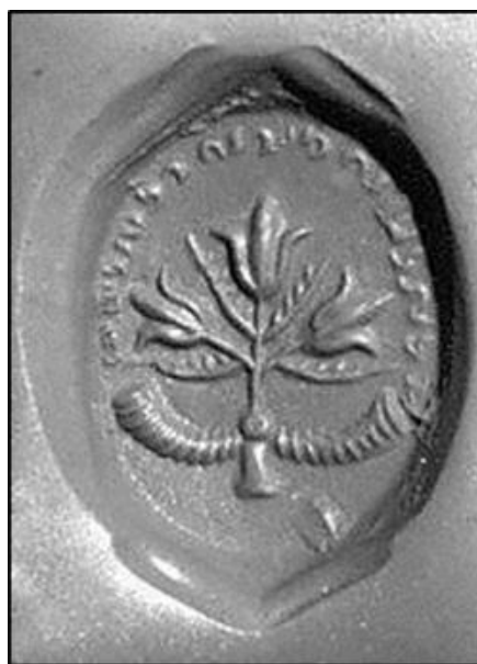
شکل ۶- مَهر ساسانی از جنس سنگ یمانی با نقش گل لاله