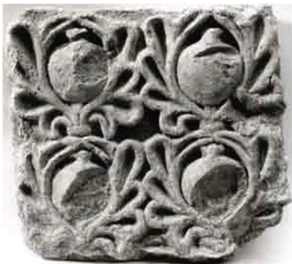
شکل ۵- نقش انار داخل برگ های نخل، کاخ تیسفون، (منبع: www.metmuseum.org )