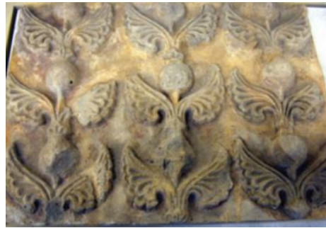
شکل ۱۱- حاشیه تزئینی، اواخر دوره ساسانی، موزه مترو پولیتن، منطقه نظام آباد ایران