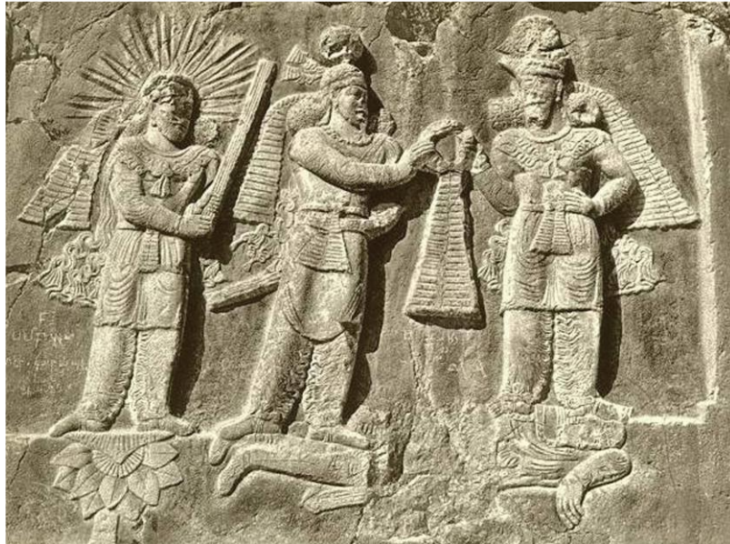
شکل ۱- نقش اعطای نشان به اردشیر در حضور ایزد مهر که روی گل نیلوفر ایستاده است و برسم در دست دارد. طاق بستان