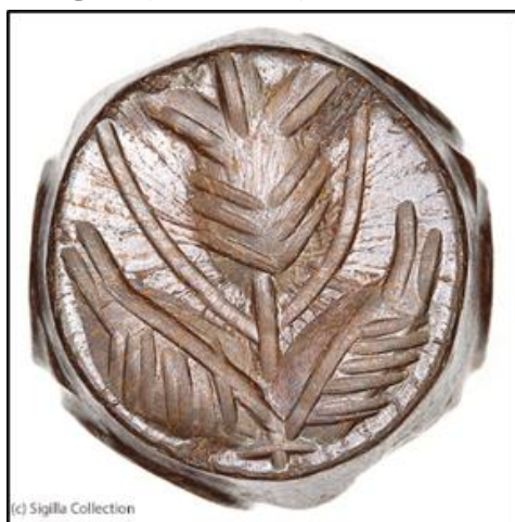
شکل ۴- مهر ساسانی با نقش شکوفه انار (منبع: sigilla.at)