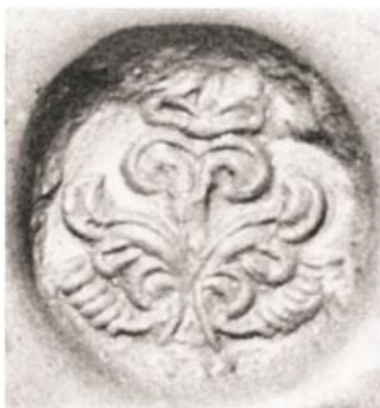
شکل ۷- مَهر ساسانی با نقش گل رز