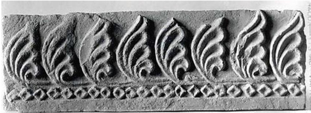
شکل ۱۴- نقش برگ های کنگر در تزئین حاشیه، کاخ تیسفون، موزه مترو پولیتن، ( منبع: www.metmuseum.org )