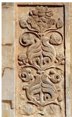
شکل ۸- نقش درخت زندگی، طاق بستان