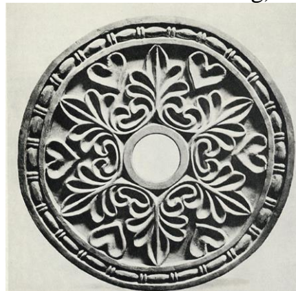
شکل ۱۲- نقش گیاهی پالمت در گچ بری کاخ تیسفون، موزه مترو پولیتن