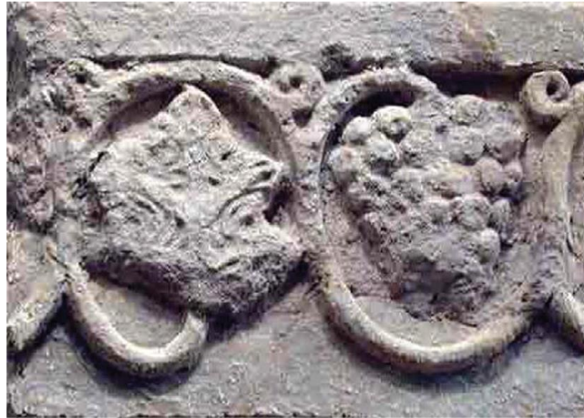
شکل ۱۰- گچبری با نقش انگور، کاخ تیسفون، موزه مترو پولیتن