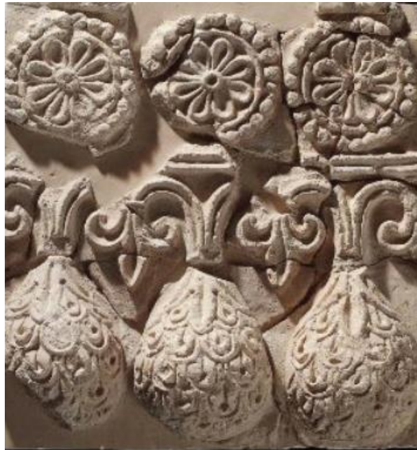
شکل ۲- نقش گیاهی لوتوس در گچ بری کاخ چال ترخان، موزه بوستون، (منبع: