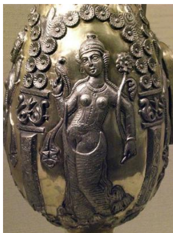
شکل ۴- نقش زن همراه با پرنده و لوتوس ( http://www.parsianforum.com )