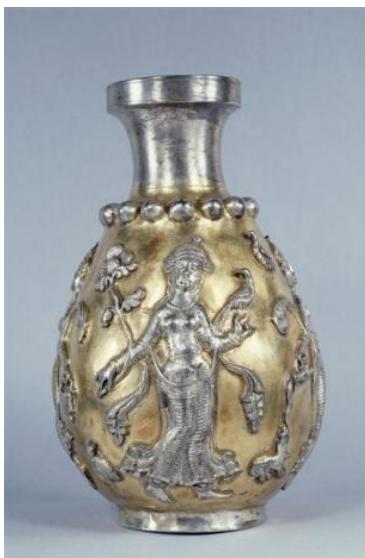
شکل ۱۲: گلدان ساسانی با نقش زن - گل نیلوفر و پرنده، محل نگهداری موزه متروپولیتن (جیمز، ۱۳۸۳)