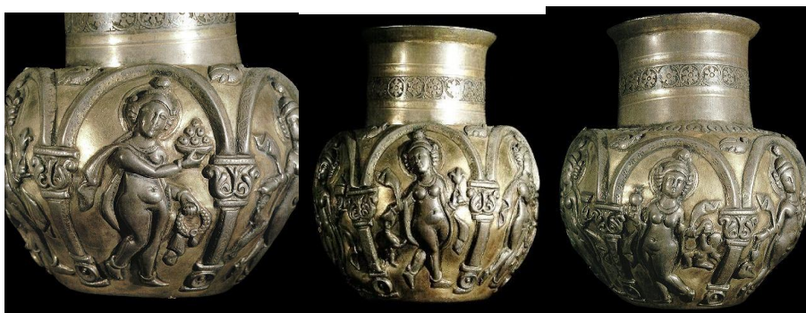
شکل ۱۱: نقش زنان رقاصه بر روی ظروف ساسانی، قدمت قرن ۷ میلادی، محل نگهداری موزه ارمیتاژ ( https://depts.washington.edu/silkroad/museums/shm/shmsasanian.html )