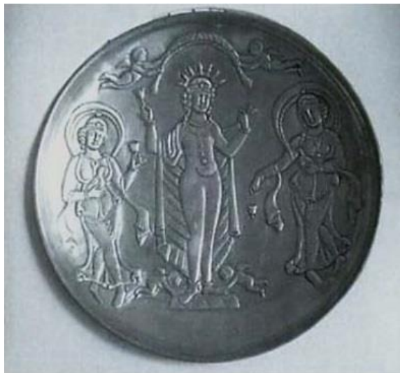
شکل ۹: بشقاب فلزی ساسانی محل نگهداری موزه متروپولیتن (Freer, 2015: 27)