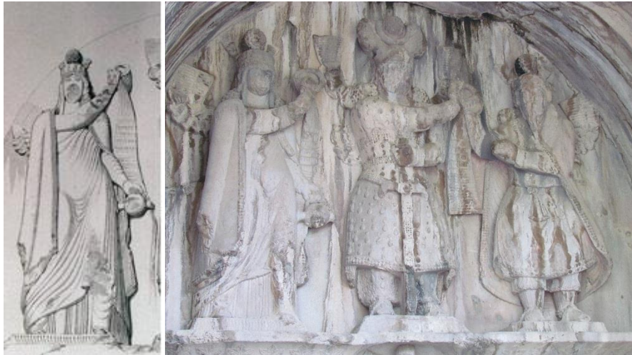
شکل ۲- نقش برجسته خسرو دوم و طرح پوشش آناهیتا در طاق بستان (نگارندگان، ۱۳۹۸)