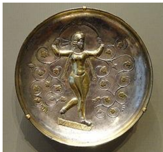
شکل ۸- نقش زن در بشقاب تخت در بین تاک، محل نگهداری موزه ارمیتاژ