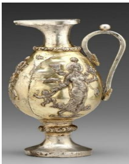
شکل ۵: ابریق های دوره ساسانی، محل نگهداری موزه ملی تهران ( http://www.asia.si.edu/collections/singleObject.cfm )