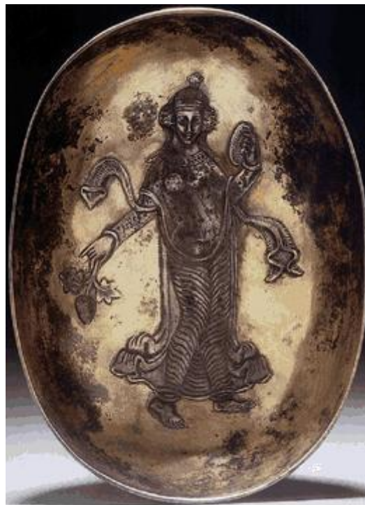
شکل ۷: بشقاب دوره ساسانی، محل نگهداری موزه سن پترزبورگ