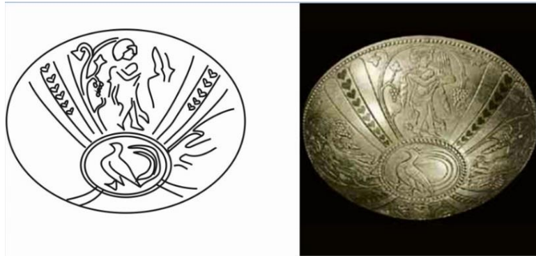
شکل ۶: کاسه با نقش خنیاگران، موزه ملی ایران باستان (پوپ، اکرم، ۱۳۸۷: ۲۲۵)