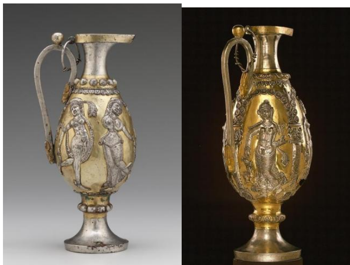
شکل ۳: ابریق های دوره ساسانی، محل نگهداری موزه ملی تهران ( http://www.metmuseum.org )