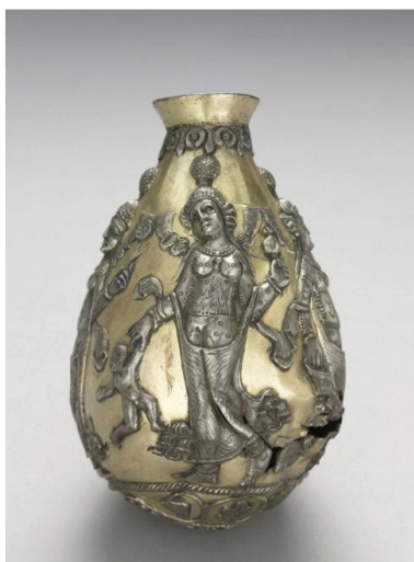
شکل ۱۳: گلدان با نقش آناهیتا و کودک، موزه کلیولند، ( http://www.clevelandart.org/art/1962.294 )