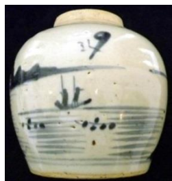
شکل ۱: تصویر انسانی سوار بر قایق بر روی کوزه سفالی آبی و سفید