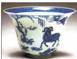
شکل ۲: نقش حیوانی بر روی سفال آبی و سفید چین