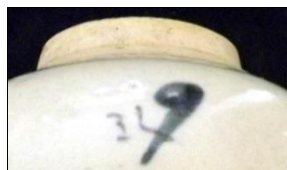
شکل ۸: امضاء سازنده سفال بر روی ظرف آبی و سفید