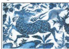
شکل ۴: بخشی از سفالینه آبی و سفید چین دارای نقش اسب فلس دار (ماخذ: John Carsew II, 2000, 41)