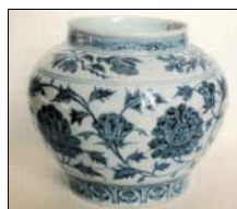
شکل ۵: ظرف آبی و سفید چین با نقوش گیاهی