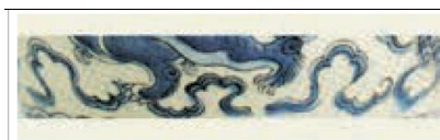
شکل ۶: بخشی ظرف آبی و سفید ایران با نقش ابرک