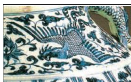
شکل ۳: بخشی از سفالینه آبی و سفید چین دارای نقش سیمرغ (ماخذ: John Carsew II, 2000, 58)