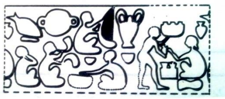
تصویر ۴- اثر مهر از چغامیش، هزاره چهارم پیش از میلاد.