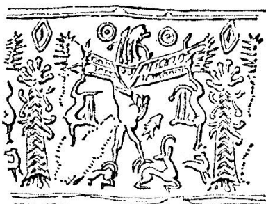
تصویر ۲- اثر مهر استوانه ای از چغازنبیل، ۱۳۰۰ ق. م، بدل چینی، موزه لوور، پاریس.