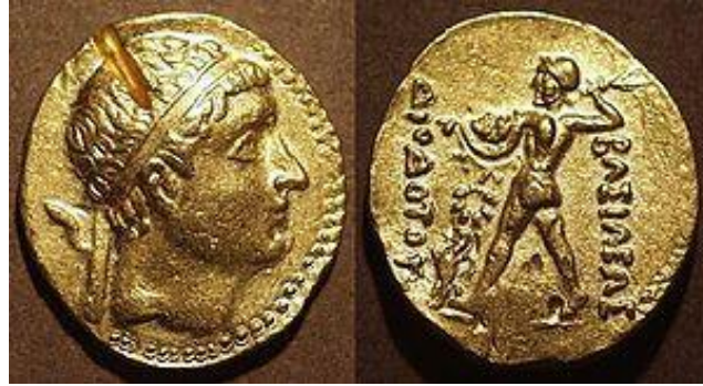
تصویر ۷- دیودوتوس دوم