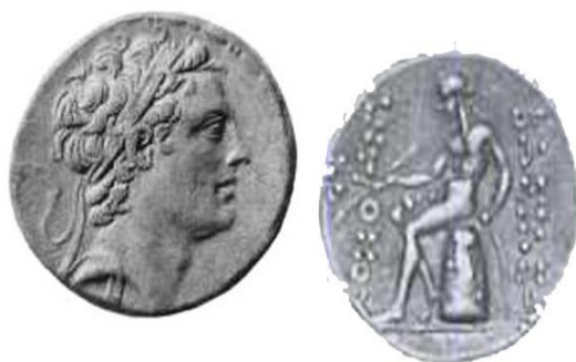
تصویر ۵- آنتی خوس چهارم