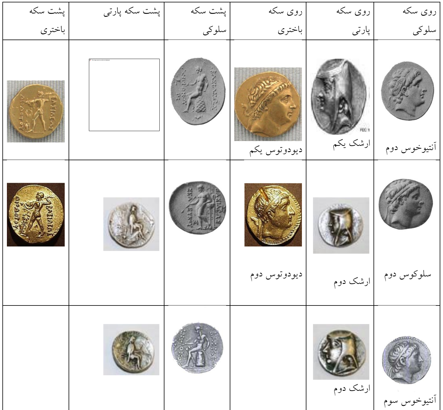
جدول ۱- مقایسه مسکوکات سلوکی، باختری و پارتی