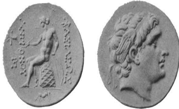
تصویر ۱: آنتی خوس دوم