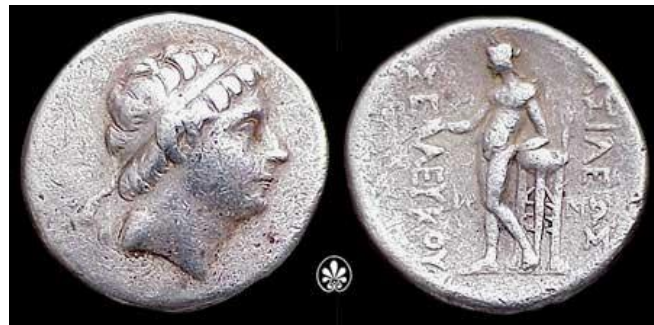
تصویر ۲- سلوکوس دوم