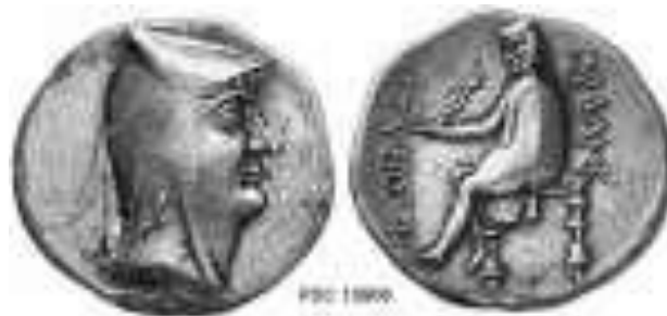
تصویر ۹- مسکوکات ارشک یکم (S1.1)