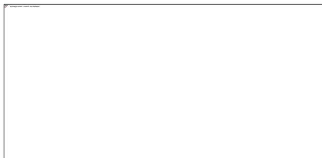
تصویر ۱۳- ارشک دوم (S6.1)