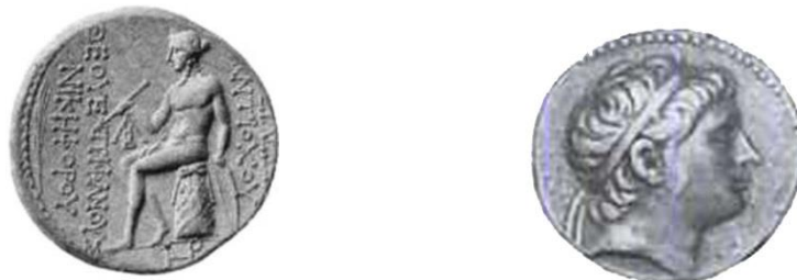
تصویر ۳- آنتی خوس سوم