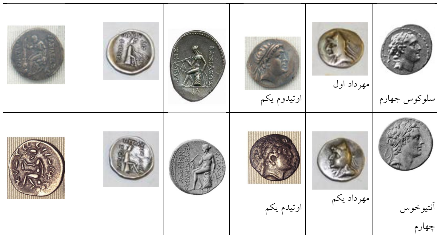
جدول ۲- وجه تشابه و اختلاف روی مسکوکات