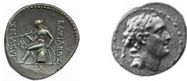
تصویر ۴- سلوکوس چهارم