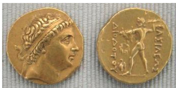
تصویر ۶- مسکوکات دیودوتوس یکم