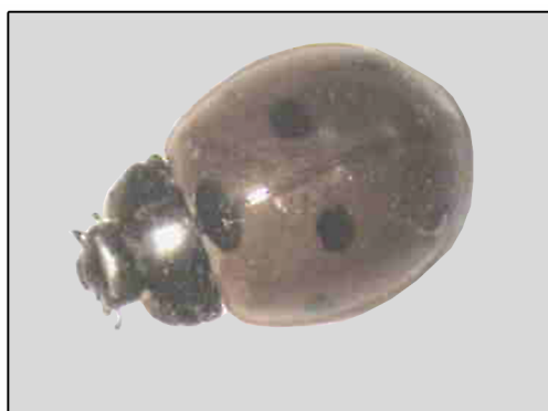
شکل ۲- کفشدوزک هفت نقطه‌ای

بالتوری‌ها دیرتر از دو گروه دشمنان طبیعی قبلی