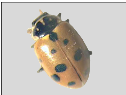
شکل ۴- Hippodamia variegata