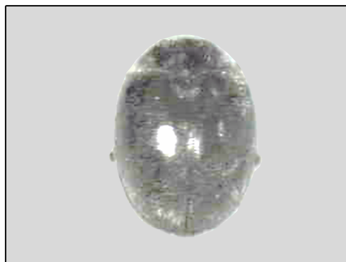
شکل ۵- Scymnus cf. frontalis