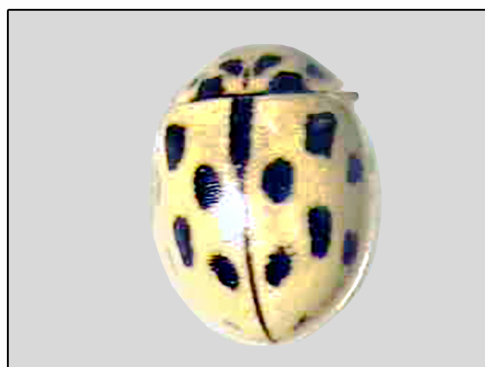
شکل ۷- Propylea quatuordecimpunctata