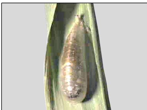
۸- شفیبه مگس‌های سیرفید