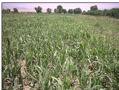
شکل ۱- مزرعه سورگوم جارویی