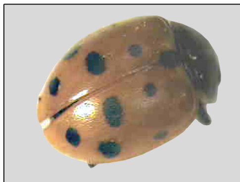
شکل ۳- کفشدوزک ۱۱ نقطه‌ای