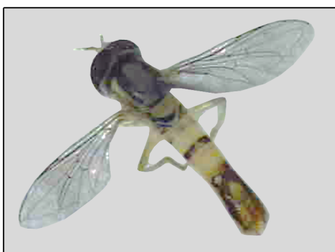
شکل ۶- مگس Sphaerophoria scripta