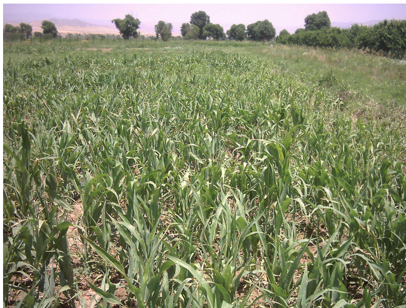
شکل ۱- مزرعه سورگوم جارویی

به عبارت دیگر جمعیت پارازیتوئید با افزایش جمعیت شته‌ها، افزایش و با کاهش آن، کاهش یافته است. به نظر (Jervis 1996) همبستگی مثبت بالا بین دشمن طبیعی و میزبان ناشی از تخصص میزبانی بوده و می‌تواند به عنوان یکی از علل کارایی خوب دشمن طبیعی به شمار آید (۱۹).