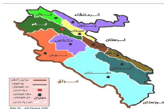
نگاره ۱. موقعیت شهرستان ایلام در سطح استان ایلام

حیدرآباد در دل دهستان میش خاص و در ناحیه جنوب غرب شهرستان ایلام قرار گرفته است. روستای حیدرآباد از ۳۰ کیلومتری شهر ایلام شروع شده و تا ارتفاعات طولاب در نزدیکی روستا امتداد دارد. آمیختگی جنگل و باغ‌های میوه، به خصوص درختان گردو، همراه با چشمه‌ها و رودهای خروشان، چشم‌اندازی زیبا به این دره بیلاقی بخشیده است. این دره هم از نظر جذب گردشگر و هم از نظر تولید محصولات باغی، از جمله منابع درآمدزا و مهم استان و روستاییان به شمار می‌آید. بافت این روستا نکات جالب توجهی دارد، چون در این روستا کوچه‌بندی شده و هر کوچه یک اسم دارد و موزاییک شدن کوه‌ها و تمیزی روستا نشان می‌دهد طرح هادی تا حدود زیادی در روستا اجرا شده است. در این روستا، ایستگاه مطبوعاتی، سطل زباله‌های مخصوص، سرویس بهداشتی، آب سرد کن و... وجود دارد و این روستا از جمله مناطق استان ایلام است که مردم در توسعه و اجرای طرح‌های مختلف آن مشارکت فعال دارند و هر ساله در دهه سوم خرداد، جشن برداشت زردآلود در این روستا برگزار می‌شود. در این جشن بهترین محصول و باغدار نمونه معرفی می‌شود. روستای کوهستانی حیدرآباد ۱۴۰۰ متر از سطح دریا ارتفاع دارد و اقلیم آن معتدل و کوهستانی است و در فصول بهار و تابستان و اوائل پاییز، هوایی معتدل و در زمستان هوایی سرد دارد. روستای حیدرآباد با داشتن طبیعت زیبا و ظرفیت‌های بالقوه طبیعی فراوان به عنوان یکی از قطب‌های اصلی گردشگری به شمار می‌رود. همچنین منطقه مورد مطالعه دارای جاذبه‌های طبیعی همچون چشمه‌ها، باغات میوه، زمین‌های کشاورزی مستعد، تپه و دشت‌های سرسبز، اردوگاه تفریحی، گیاهان دارویی، بافت معماری سنتی و ... می‌باشد.