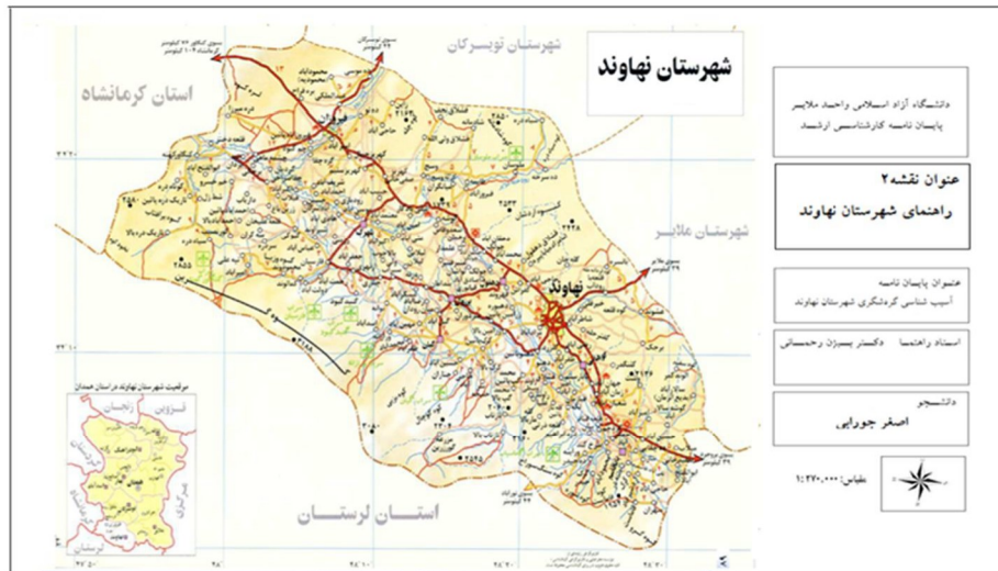
نقشه ۲: راهنمای شهرستان نهاوند