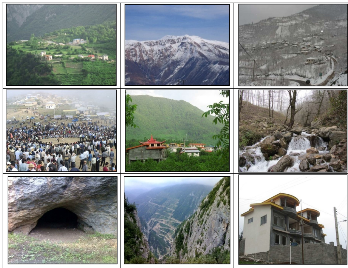
شکل ۲. انواع جاذبه‌های گردشگری ناحیه اشکوروات