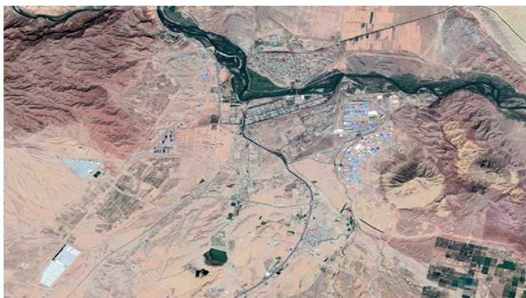
شکل شماره ۳: تصویر ماهواره‌ای گوگل ارث؛ توسعه شهری، توسعه صنعتی - اقتصادی شهر جلفا در مهرماه ۱۴۰۰ منبع: (سایت منطقه آزاد تجاری - صنعتی ارس).