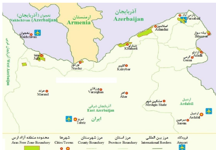
شکل شماره ۲: نقشه شهرهای پیرامون منطقه آزاد ارس