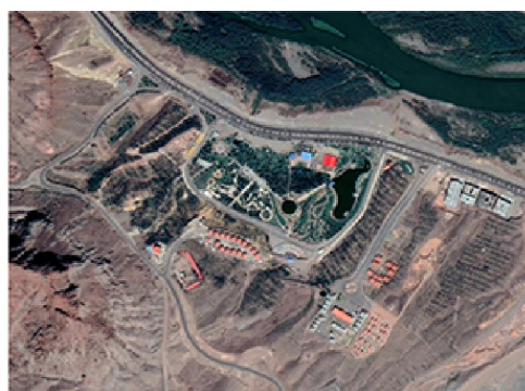
شکل شماره ۴: تصاویر ماهواره‌ای گوگل ارث؛ تغییر کاربری زمین بایر به وسعت بیش از ۳۰ هکتار به مرکز تجاری، تفریحی و رفاهی با نام پارک کوهستانی منطقه آزاد ارس طی سال‌های ۱۳۸۶ (تصویر سمت چپ) تا ۱۴۰۰ (تصویر سمت راست)