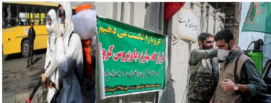
تصویر ۲. نمونه‌های رعایت مسئولیت‌پذیری اجتماعی توسط نهادها و سازمان‌های محلی

بر اساس داده‌های این جدول مشخص می‌شود که متغیر اطلاع رسانی محیطی توسط نهادها و سازمان‌های محلی میانگین کمتر از ۳ (بر اساس طیف لیکرت) به میزان ۲/۷۵ را به دست آورده است و این نشان می‌دهد اطلاع رسانی محیطی از جمله نصب بنر، توزیع بروشور، تابلونوشته‌های توصیه‌ای در مسیرهای ویژه گردشگری و باتوجه به بیشترین تردد گردشگران از این مسیرها به منظور اطلاع رسانی در راستای رعایت پروتکل‌های بهداشتی و پیشگیری از شیوع بیماری کووید ۱۹ کم بوده و در کل نهادها و سازمان‌های محلی وضع این متغیر را در مسیرهای گردشگری شهرستان بینالود مناسب ارزیابی نمی‌کنند و از اطلاع رسانی محیطی رضایت ندارند. همچنین در متغیر انجام اقدامات بهداشتی با توجه به میانگین نسبی به دست آمده ۳/۵۶ مشخص گردید که میزان متغیر از نظر نهادها و سازمان‌های محلی در وضع مطلوبی قرار دارد بنابراین می‌توان بیان داشت که اقدامات بهداشتی از جمله جانمایی تجهیزات بهداشتی و ضدعفونی دوره‌ای معابر توسط گروه مورد بررسی در جهت کاهش بیماری کووید ۱۹ در مسیرهایی که بیشترین حجم گردشگر را به منظور استفاده از واحدهای پذیرایی دارند انجام می‌شود. در بعد کمک به نهادهای بالادست از جمله همکاری با فرمانداری، نیروی انتظامی، اداره بهداشت و... در اقدامات پیشگیرانه از شیوع بیماری کووید ۱۹ نیز میانگین به دست آمده بالاتر از سطح متوسط بوده و این نشان می‌دهد که سازمان‌ها و نهادهای محلی عملکرد خود را نسبت به همکاری با نهادهای بالادست مناسب ارزیابی می‌کنند.