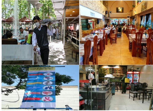
تصویر ۳. نمونه‌های رعایت مسئولیت‌پذیری اجتماعی در واحدهای پذیرایی

در ادامه نیز برای سنجش وضعیت رعایت مسئولیت‌پذیری در گروه سوم یعنی فعالیت‌های اجرایی توسط کارشناسان سازمان‌ها و نهادها، بر اساس معیارهای تجمیع شده و با استفاده از آزمون T مورد سنجش قرار گرفت (جدول ۶).