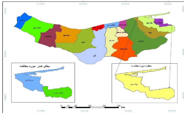
نقشه ۱: موقعیت شهرستان بهشهر در تقسیمات سیاسی (Behshahr Municipality, 2020).