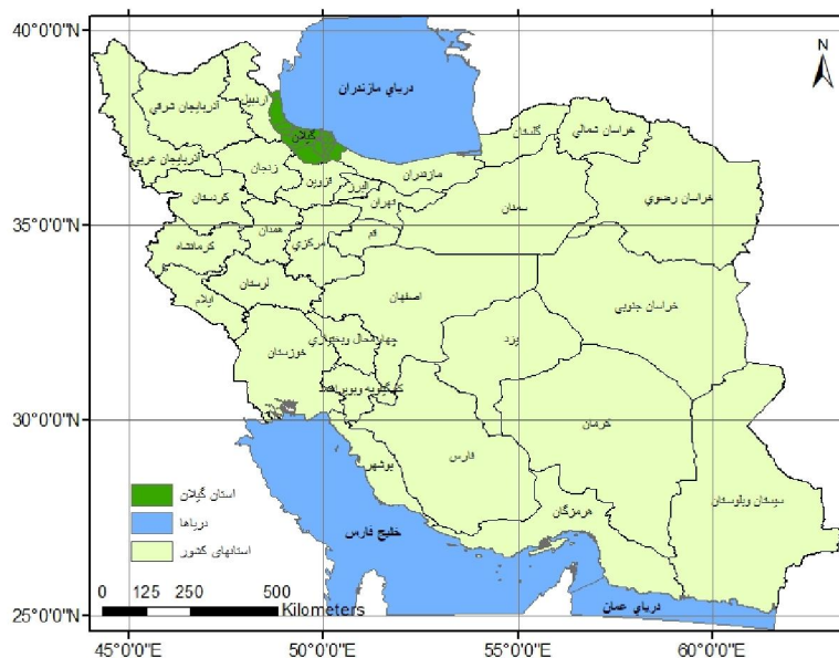
شکل شماره ۱: نقشه موقعیت استان گیلان در کشور ایران