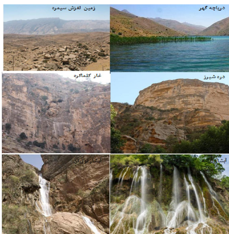
شکل ۲: محدوده‌های مورد بررسی جهت احداث ژئوپارک در محدوده‌ی شهرهای منتخب استان لرستان

طبق بررسی‌های به‌عمل آمده و ارزیابی پرسشنامه‌ها، ارزش هر یک از معیارها برای ژئومورفوسایت-های مورد مطالعه که شامل دریاچه گهر در شهرستان درود، آبشار بیشه و نوژیان در شهرستان خرم‌آباد، غار کلماکره و زمین لغزش سیمره در شهرستان پلدختر و دره شیرز در شهرستان کوهدشت می‌باشند (شکل ۲)، مشخص و محاسبه گردید. بر اساس برآوردهای به‌عمل آمده، دریاچه گهر با میانگین ۱۵,۹۹ بیشترین و غار کلماکره با ۱۲,۵۳ کمترین امتیاز را دارند. هم‌چنین لندفرم‌های آبشار بیشه، دره شیرز، آبشار نوژیان، زمین لغزش سیمره در رده‌های دوم تا پنجم قرار گرفتند (جدول ۲).