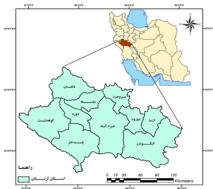
شکل ۱: موقعیت محدوده مورد مطالعه

استان لرستان با مساحت ۲۸۵۵۹ کیلومتر مربع در غرب ایران، ۱/۷ درصد از کل مساحت کشور را در بر می‌گیرد. این استان بین مدارهای ۳۲ درجه و ۳۷ دقیقه تا ۳۴ درجه و ۲۲ دقیقه عرض شمالی و ۴۶ درجه و ۵۱ دقیقه تا ۵۰ درجه و ۳ دقیقه طول شرقی از نصف‌النهار گرینویچ قرار گرفته است. استان لرستان، از شمال به استان‌های مرکزی و همدان، از جنوب به استان خوزستان، از شرق به استان اصفهان و از غرب به استان‌های کرمانشاه و ایلام محدود می‌شود. شکل ۱، موقعیت استان لرستان را به تفکیک شهرستان در ایران نشان می‌دهد.