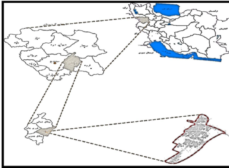
شکل ۱: موقعیت جغرافیایی منطقه مورد مطالعه، تهیه و ترسیم: نگارندگان، ۱۳۹۲.