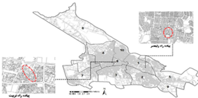
تصویر ۱- موقعیت قرارگیری پیاده راه های تربیت و ولیعصر کلانشهر تبریز

کوی ولیعصر در قسمت شرقی و در بافت نوساز کلانشهر تبریز واقع شده است که دارای سابقه کوتاه مدت، حدود پنجاه ساله می باشد. این کوی، محور ولیعصر با عرض ۲۰ متر را در خود جای داده است که کاربری مادر آن در ابتدا مسکونی بوده؛ اما به مرور زمان به کاربری تجاری تبدیل شده است. این محور که با عنوان استاد شهریار یا سنگفرش نیز شناخته می شود، فلکه بزرگ را به فلکه بازار پیوند می دهد (عباس زاده و تمری، ۱۳۹۱: ۷-۶).