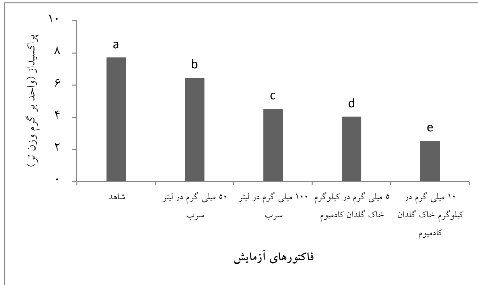
شکل ۱- مقایسه میانگین پراکسیداز تحت تاثیر سرب و کادمیوم