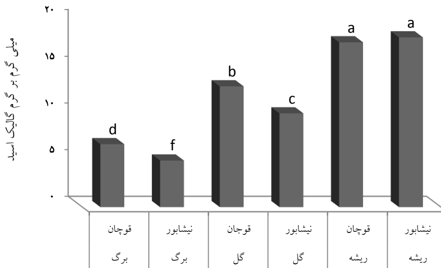
شکل ۱: مقایسه میانگین میزان فنل کل در عصاره باریجه تحت تاثیر اثر متقابل اندام گیاه و رویشگاه

در نتایج بدست آمده در این پژوهش (شکل‌های ۱ تا ۳) عصاره گل باریجه میزان فعالیت آنتی اکسیدانی بیشتری نسبت به سایر اندام‌ها داشتند. بیشترین فعالیت آنتی اکسیدانی مربوط به عصاره متانولی گل باریجه با ۸۴/۵ درصد مهار رادیکال‌های آزاد بود. بیشترین میزان فلاونوئید در عصاره متانولی ریشه باریجه در رویشگاه نیشابور (۱۵/۲۰ میلی گرم بر گرم کوئرستین)، کمترین میزان آن نیز در عصاره برگ‌های