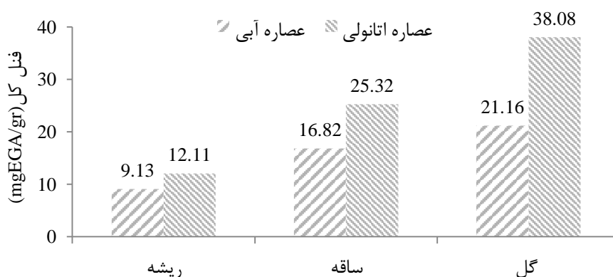
شکل ۲: مقایسه مقادیر فنل کل در عصاره‌ها و اندام‌های مختلف گیاه دارویی یونجه زرد در رویشگاه چهارباغ

نتایج بررسی فیتوشیمیایی فلاونوئیدی گیاه طبق شکل ۱، نشان داده شده است که میزان فلاونوئید عصاره اتانولی اندام‌ها به ترتیب در گل ۶۲/۴، ساقه ۴۹/۰۹ و ریشه ۳۲/۲۵ میلی‌گرم معادل کوئرستین در هر گرم وزن خشک گیاه، از بالاترین مقدار خود برخوردار است.