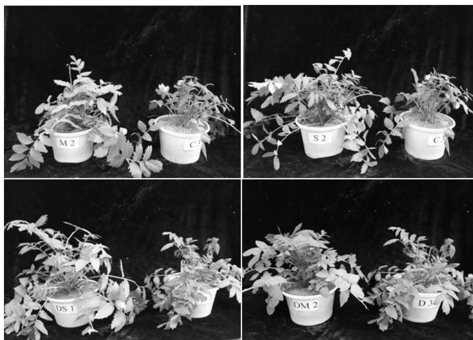
شکل ۲: تفاوت رشد اندام هوایی گیاهان سنبل الطیب تلقیح شده نسبت به گیاهان شاهد [بالا/سمت چپ: گیاه تلقیح شده با قارچ اسپور (S)، میسلیوم (M)، بالا/راست: گیاهان شاهد در شرایط ظرفیت زراعی]؛ [پائین/سمت چپ: گیاه تلقیح شده با قارچ اسپور (S)، میسلیوم (M)، پائین/راست: گیاهان شاهد در شرایط تنش خشکی]