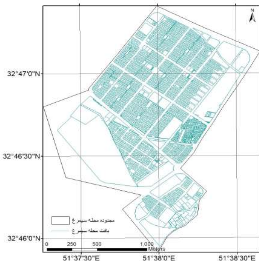
شکل (۱): نقشه محله سیمرخ

مسئله اصلی این پژوهش و دغدغه‌ی ذهنی محقق شناسایی و رتبه‌بندی فرصت‌ها و چالش‌های محله‌ی نوبنیاد سیمرخ در ارتباط با هسته‌ی اصلی شهر خورزوق است.