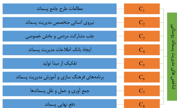
شکل (۲): کد و عنوان شاخص‌های مدیریت بهینه پسماند روستایی مورد استفاده

تشکیل ساختار سلسله مراتبی، مهم‌ترین مرحله فرآیند تحلیل سلسله مراتبی می‌باشد، زیرا در این بخش با تجزیه مسائل دشوار و پیچیده، می‌توان آن‌ها را به گونه ساده، که با ذهن و طبیعت انسان مطابقت داشته باشد، تبدیل می‌کند (سیمرن و همکاران، ۲۰۰۷: ۳۶۳). در واقع، اولین قدم در فرآیند تحلیل سلسله مراتبی ایجاد یک نمایش گرافیکی از مسئله (ساختار سلسله مراتبی) است که در رأس آن، هدف کلی و در سطوح خرد، معیارها، زیر معیارها و گزینه‌ها قرار دارند (اسکوت، ۲۰۰۵: ۵۹۱).