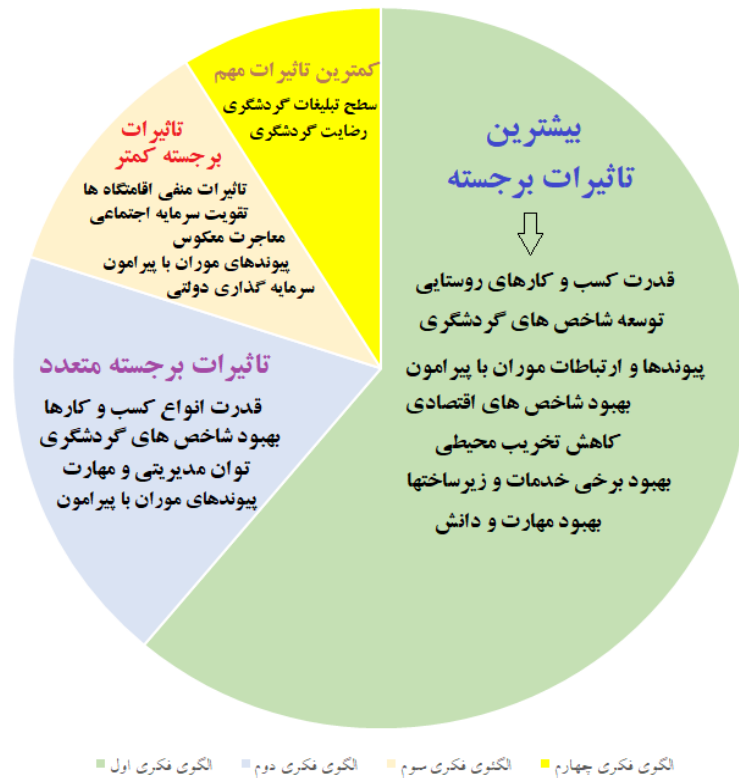
شکل (۳): گراف الگوهای فکری چهارگانه حاکم بر تأثیرات اقامتگاه‌های بوم‌گردی بر توسعه روستایی بخش موران

در بخش مقایسه بین نتایج کار این پژوهش با مطالعات بین‌المللی، نشان می‌دهد که با وجود پرداختن این مطالعات به ابعاد مختلف اقامتگاه و توسعه روستایی کمتر به مسئله تحلیل الگوهای فکری حاکم و نگرش‌ها و دیدگاه‌های مختلف پرداخته شده و از این نظر این پژوهش رویکرد تازه‌ای را به کار گرفته است. در این پژوهش با توجه به نتایج حاصله و شرایط بخش موران و نزدیکی به مناطق مرزی و در نظر گرفتن اصول طراحی اقامتگاه‌ها و کسب و کارها تلاش شده است تا با تبیین ساختار الگوهای ذهنی و فکری، طرز تفکرهای مختلف بین کارشناسان و مردم بومی و محققین را شناسایی کند. در واقع این پژوهش به نوعی می‌تواند تفاوت گروه‌های کارشناسان را از نظر چشم‌انداز اقامتگاه‌های بوم‌گردی مشخص نماید.