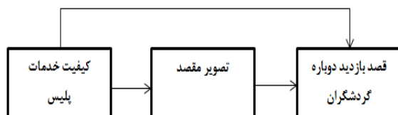
شکل (۱): مدل مفهومی تحقیق

در این بخش مدلی مفهومی جهت تأثیر کیفیت خدمات پلیس بر تصویر مقصد و قصد بازدید دوباره گردشگران، با مطالعه روابط سازه‌های مطرح شده، پیشینه تحقیق و ادبیات موضوع ارائه می‌گردد. چهارچوب مفهومی تحقیق در شکل ۱ ارائه شده است. این چهارچوب شامل متغیرهای کیفیت خدمات پلیس، تصویر مقصد و قصد بازدید دوباره گردشگران می‌باشد.