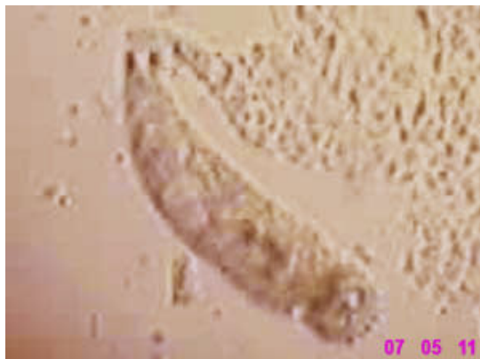
نگاره ۴- داکتیلوژیروس (× ۴۰۰)