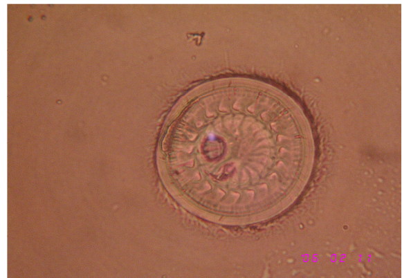
نگاره ۲- تریگودینا (× ۴۰۰)