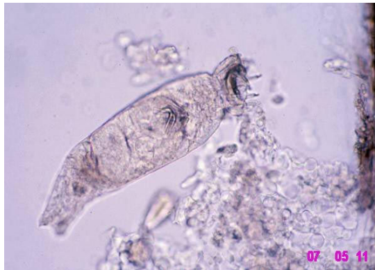
نگاره ۳- ژیروداکتیلیوس (× ۴۰۰)