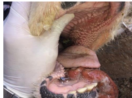
شکل ۴- نتایج درمان با غلظت ۵ درصد عصاره گیاه علف چای پس از ۴ روز در یکی از گاوهای درگیر در کانون شماره ۲ (درجه پاسخ به درمان، خوب مشاهده گردید).

اثرات عصاره یا اسانس برخی از گیاهان روی بهبودی ضایعات دهانی تب برفکی انجام شده است. از جمله مشخص شده است که مصرف اسانس گیاه مورد بر روی ضایعات دهانی ناشی از بیماری تب برفکی