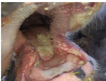
شکل ۲- نمایی از محوطه دهانی دام مبتلا به تب برفکی در کانون شماره ۳ مورد مطالعه همراه با ضایعات درجه ۳. به اروزیون، زخم و کنده شدن مخاط زبان در بخش نوک آن توجه شود.

لازم به ذکر است که انتخاب دام‌های مورد مطالعه به صورت تصادفی صرف نبود، بلکه به صورت تصادفی خوشه‌ای انتخاب شدند طوری که فراوانی دام‌های واجد درجات ۱، ۲ و ۳ جراحات، در گروه‌های تیمار و شاهد تقریباً به یک تعداد باشد و تفاوت معنی‌داری با هم نداشته باشند.