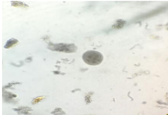
شکل ۲- تروفوزوایت آنتامبا کولامی (رنگ آمیزی تری کروم ماسون، درشت‌نمایی ۱۰۰×).