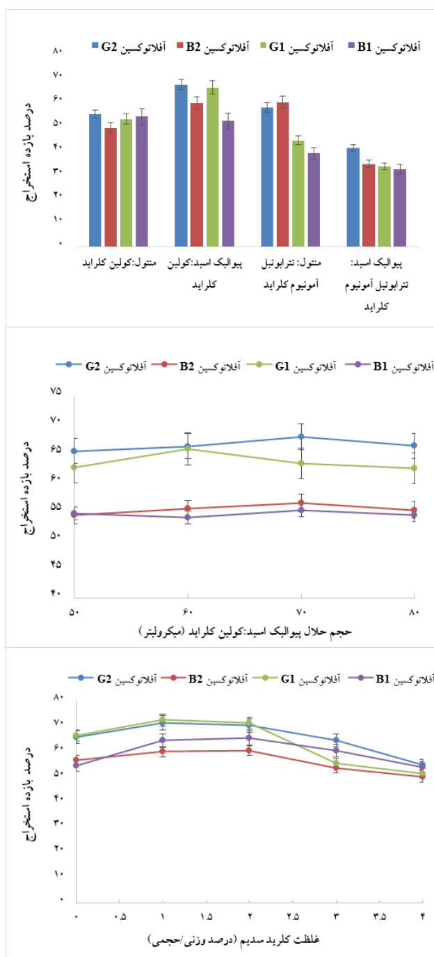
شکل (۲) - بهینه‌سازی عوامل موثر در کارایی مرحله دوم استخراج آفلاتوکسین‌های هدف از نمونه ذرت