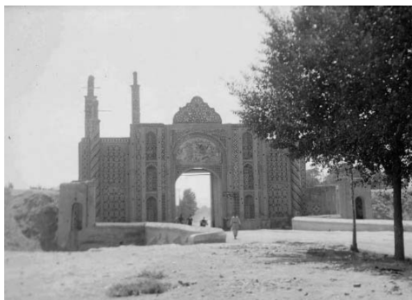
تصویر ۲. تهران، ۱۹۳۰ م. (ULR 2)