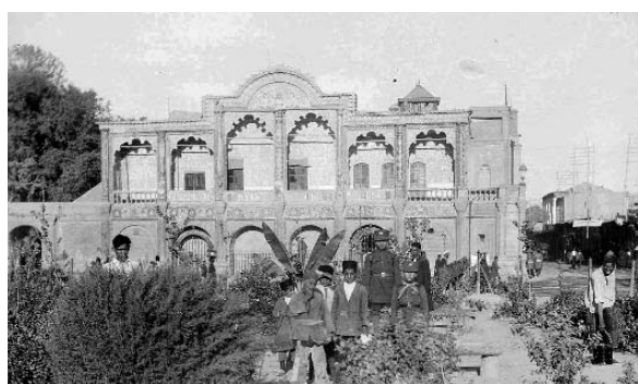
تصویر ۷. بانک ملی، ۱۹۰۰-۱۹۳۰ م. (ULR 2)