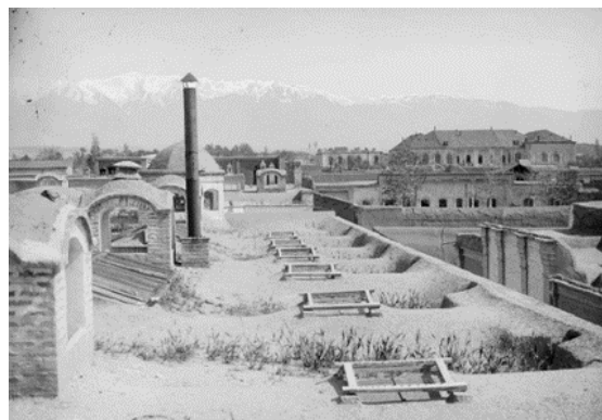
تصویر ۱. نمایی از بام های شهر تهران رو به رشته کوه البرز، ۱۹۰۰-۱۹۳۱ م. (ULR 2)