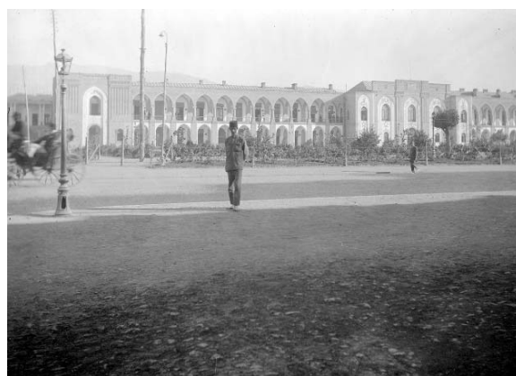
تصویر ۴. دروازه دولت، تهران، ۱۹۲۰-۱۹۳۰ م.