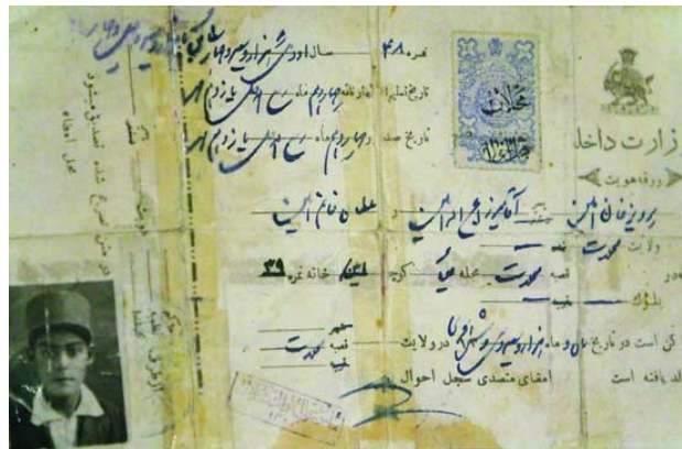
تصویر ۸. کاربرد عکس در مدارک هویتی (یوشی زاده، ۱۳۹۱)

از ابتدای ورود دوربین به ایران در زمان محمد شاه قاجار و به‌ویژه در زمان ناصرالدین شاه، عکاسی فنی شاهانه و در خدمت سلاطین بود. دوران مشروطیت صنعت عکاسی از انحصار دربار خارج شد. تا اوایل قرن ۱۴ شمسی عکاسی کاربرد تخصصی نداشت و بیشترین تصاویر ثبت شده عکس‌های یادگاری بود تا اینکه با اجباری شدن الصاق عکس به برگه‌های احراز هویت، گذرنامه، شناسنامه و مدارک تحصیلی در دوره پهلوی کارکرد جدیدی از عکاسی در فرهنگ و جامعه ایرانی رایج گردید (رحمانیان و ثقفی، ۱۳۹۳، ۶۴). تصویر ۸، نمونه‌ای از کاربرد عکس در مدارک هویتی را نشان می‌دهد. عکس دستگاه شبیه‌ساز هویت است. مهم‌ترین و نخستین چیزی که عکس ارائه می‌دهد شباهت به اصل است. "تصویر عکاسی با هستی مدلی که بازسازی کرده است، اشتراک دارد" (سارکوفسکی، ۱۳۸۲، ۱۲). واضح است هنگامی که عکس‌ها، برای تعیین هویت اشخاص به کار می‌روند، عمیقاً هویت آن‌ها را نشان نمی‌دهند؛ هویت، زاینده ذهن و خیال ما از خودمان یا از دیگری است (حسن‌پور و نوروزی طلب، ۱۳۹۱، ۸).