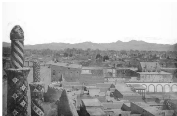
تصویر ۶. بلدیة تهران، ۱۹۰۰-۱۹۳۰ م. (ULR 2)