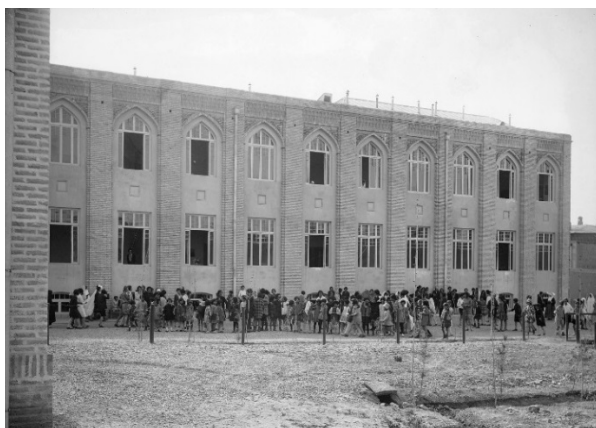
تصویر ۳. بانک شاهنشاهی ایران، تهران، ۱۹۳۱-۱۹۳۴ م.