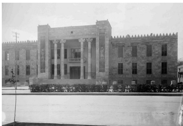
تصویر ۵. مدرسه ژاندارک، ۱۹۲۰ م. (ULR 2)