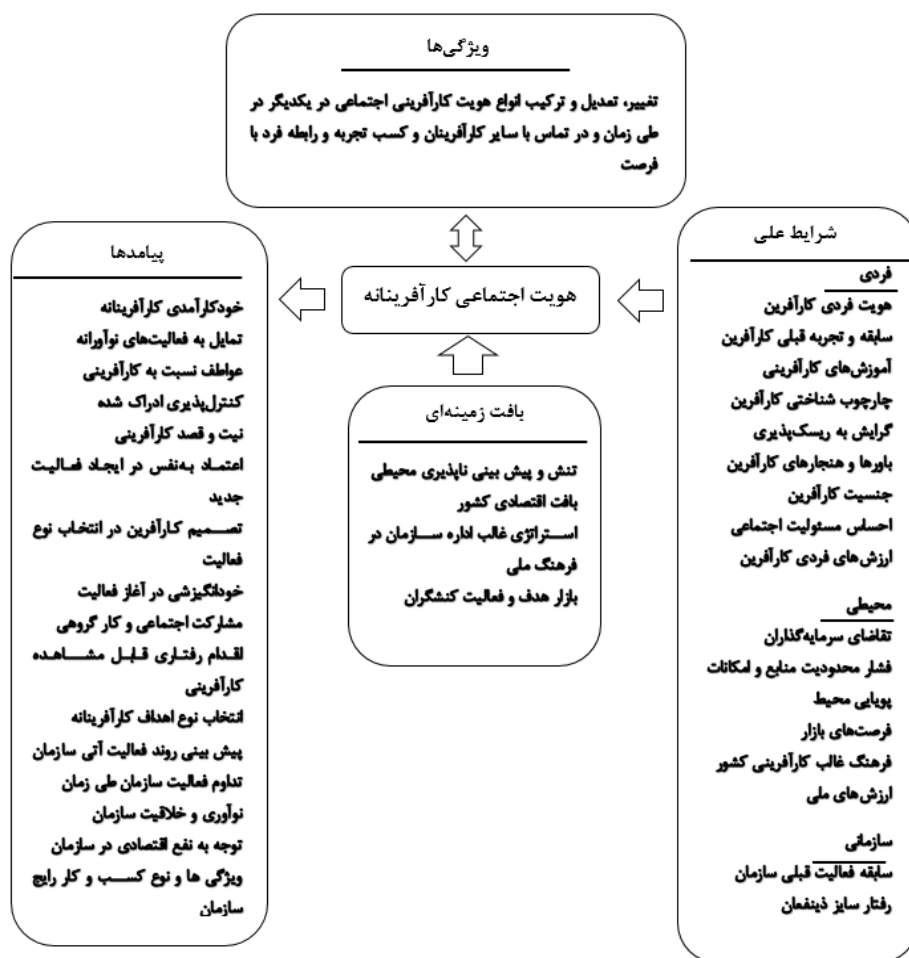
شکل (۲): الگوی مولفه‌های مرتبط با هویت اجتماعی کارآفرینی