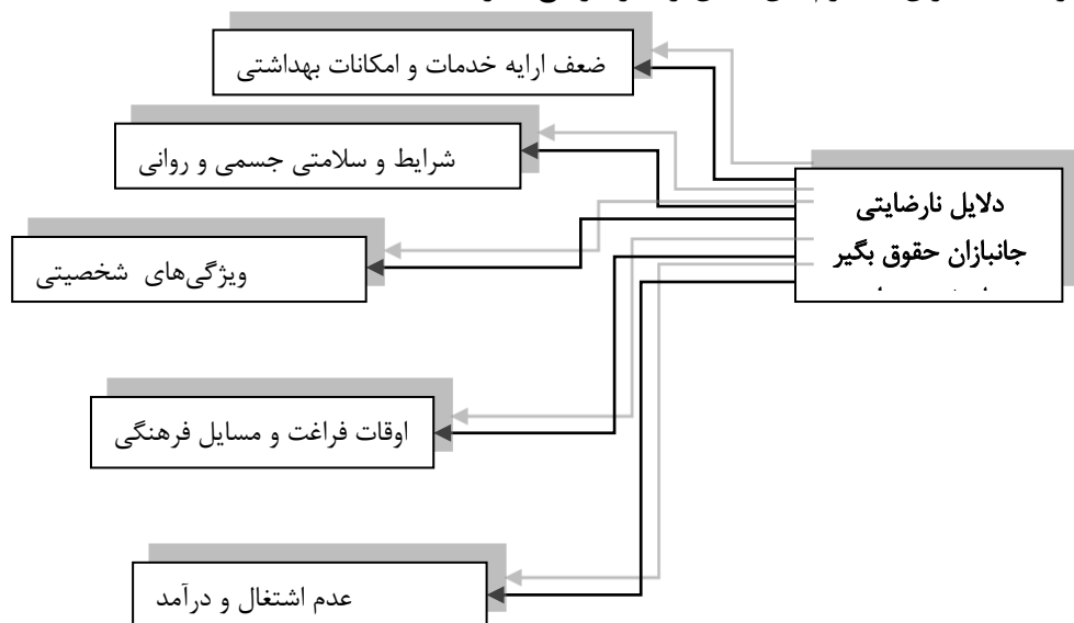
جدول ۱۲ تطابق و همسویی یافته‌های پژوهش با یافته‌های پژوهش‌های پیشین

درآمد جانبازان محترم این نقص را نیز مرتفع سازند.