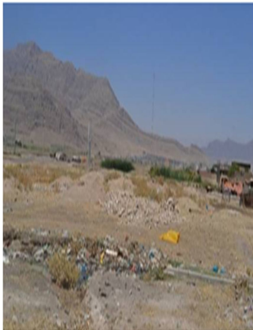
شکل ۵. معضل بهداشتی در غرب ماسور