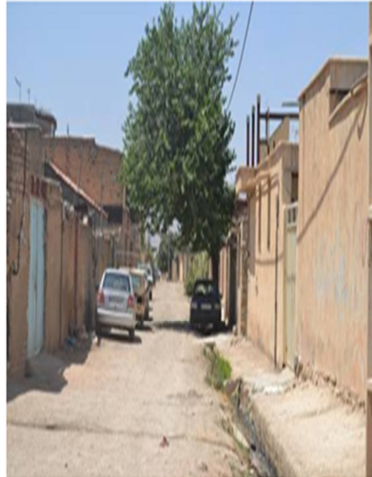
شکل ۴. وضعیت محدوددهی بهداشتی