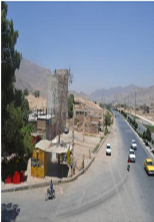
شکل ۳. ارتباط محور خرم آباد - اندیمشک به ماسور