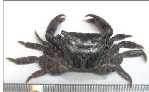
شکل ۴: نمای پشتی و شکمی گونه Metopograpsus messor .

چهارمین پای حرکتی بدون کرک در انتهای پایینی است. Cheliped ها نابرابر و Cheliped کوچکتر ۳ یا ۴ دندانانه کوچک و تیز دارند. ناحیه Merus دارای ۳ دندان کند روی قسمت مبدا و ۴ دندان تیز مثلی در قسمت انتهایی است. الگوی رنگی مشابه با M.messor است. کاراپاس اندکی تیره تر با خالهای قهوه ای که سطح کاراپاس خاکستری است. Cheliped ها خاکستری تیره تا نارنجی با نقطه های قهوه ای کوچک است (شکل ۵).