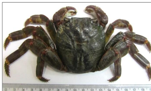
شکل ۲ - نمای پشتی و شکمی گونه Grapsus albolineatus .

کاراپاس در قسمت پشتی به شکل نیم دایره، عرض آن کمی بیشتر از طولش و اندکی عدسی مانند است که دارای خطوط کم عمق می باشد. حاشیه های کناری کاراپاس به صورت قابل توجهی منحنی است، دو دندان جلویی - کناری، به شکل مثلی بوده که به وسیله یک شکاف V شکل از هم جدا شده اند. خطوط کم عمقی از این شکاف تا بخش سینه ای امتداد دارد. ۴ لوب روی کاراپاس وجود دارد، ۲ لوب میانی بزرگتر از لوب جانبی است و بر آمدگی هایی روی لوب ها مشاهده می گردد. حلقه چشمی عمیق است، در قسمت بیرونی اندکی دانه