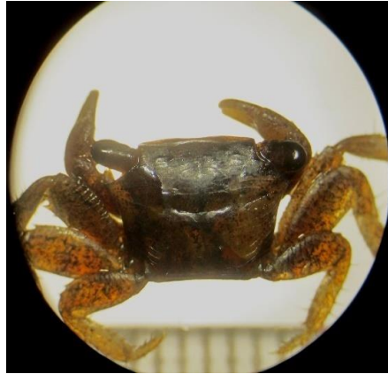
شکل ۳ - نمای پشتی و شکمی گونه Grapsus granulatus .