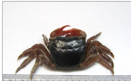
شکل ۵- نمای پشتی و شکمی گونه Metopograpsus thukuhar

شده در این پژوهش فراوانی بیشتری (۶۱ درصد) داشته است. محققان دانمارکی به گونه Metopograpsus messor را با اندازه های متفاوت در پهنه جزر و مدی سواحل مرجانی، رسی، ماسه ای بحرین، بوشهر و جزیره قشم اشاره کردند. Apel (۲۰۰۱) این گونه را از امارات متحده عربی و حسینی (۱۳۷۲) این گونه را از مناطق خشک تر ساحل با بیشینه پهنای کاراپاس ۶۰ میلی متر گزارش کرده است (۲،۱۱). سپس، عسگری (۱۳۷۸) این گونه را از سواحل جزیره قشم، محمودی (۱۳۸۹) از سواحل جاسک، ندرلو (۲۰۱۱) این گونه را از سواحل خلیج فارس، امارات متحده عربی، عربستان سعودی و سواحل ایرانی خلیج عمان و فاطمی و همکاران (۲۰۱۱) از سواحل صخره ای جزیره قشم گزارش کردند (۵،۶،۱۳،۱۴). در پژوهش حاضر، این گونه در تمام طول سال در ناحیه پایینی بین جزر و مدی جنگل حرا و ناحیه میانی بین جزر و مدی سنگ شکن، سنگ مرغان، لایروبی در میان ماسه های زیر سنگ ها مشاهده گردیده است. بیشترین فراوانی این گونه در فصل بهار (۴۶ درصد) و در جنگل حرا بود که این موضوع می تواند مرتبط با شروع فصل جفت گیری در فصل بهار باشد. این گونه بعد از گونه Grapsus albolineatus دارای بیشترین فراوانی (۳۶ درصد) در میان گونه های شناسایی شده است.