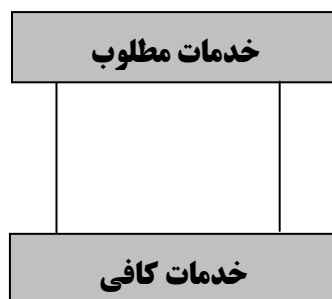
شکل ۲- استانداردهای ارزیابی عملکرد واقعی (Spiteri & Dion, ۲۰۰۴, ۶۸۰)