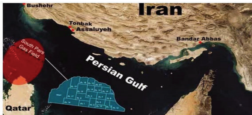
شکل ۲. میدان گازی پارس جنوبی به همراه تقسیم‌بندی فازهای توسعه ای

در واقع بخش شمال شرقی یک ساختار وسیع زمین شناسی در خلیج فارس بوده و در قطر به میدان شمالی ۱ معروف است. مخزن پارس جنوبی دارای دو لایه گازی کنگان و دالان می‌باشد. این میدان یکی از اصلی‌ترین منابع انرژی کشور به شمار می‌رود. در شکل ۲، موقعیت قرارگیری میدان گازی پارس جنوبی نشان داده شده است.