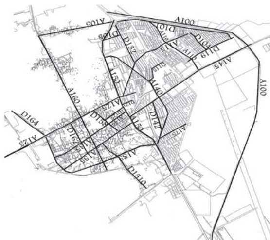
شکل ۴: شماره‌گذاری تعدادی از خیابان‌های شهر سمنان مطابق با الگوی ارائه شده

گردید. روش ارائه شده دارای کاربری آسان بوده و میتوان از آن برای اطلاع‌رسانی سریع در کارهایی نظیر اطلاع‌رسانی در مواقع بروز حادثه و بحران و آتش‌سوزی‌ها، تهیه نقشه‌های ویژه گردشگری استفاده نمود. از مزایای این روش علاوه بر سادگی و اختصاص شماره‌ای به هر خیابان، امکان رزرو شماره می‌باشد. ضمن اینکه با توجه به شماره هر خیابان می‌توان به نوع خیابان (اصلی یا توزیع کننده)، جهت، موقعیت و محدوده تقریبی آن پی برد. با استفاده از این روش خیابان‌های شهر سمنان بنحو مطلوبی شماره‌گذاری گردید.