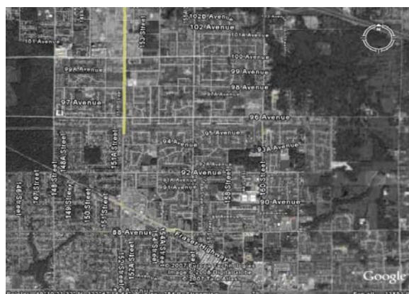
شکل ۲- شماره‌گذاری خیابان‌های شهر سوری در حال حاضر (۲۰۰۸)

مستطیل در جنوب دانست. این شکل به سبب گسترش تدریجی شهر طی ۵۰ سال گذشته و در پی احداث جاده اصلی تهران به مشهد و جلوگیری از گسترش شهر در جبهه جنوبی به سبب وجود راه آهن اصلی در امتداد شرق به غرب، به وجود آمده است. ضمناً دلیل وجود مراکز دانشگاهی در قسمت شرقی، گسترش شهر در جهت عرضی انجام شده است.