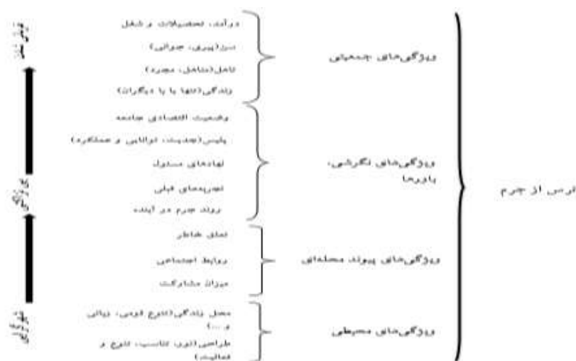
شکل ۱. مدل مفهوم تحقیق

براین اساس، سؤال اصلی تحقیق به این شکل بیان شده است که اساساً ترس از جرم در شهر اهواز تحت تأثیر کدام عوامل تشدید می‌گردد. اگرچه برای تبیین بیشتر موضوع، سؤالات جزئی‌تر فراوانی مطرح شد، اما تأکید اصلی بر این سؤال بود که اصولاً نقش متغیرهای شخصی و محیطی در ترس از جرم در محلات شهر اهواز چیست و ویژگی‌های محیطی چه نقش و جایگاهی را به خود اختصاص داده‌اند؟