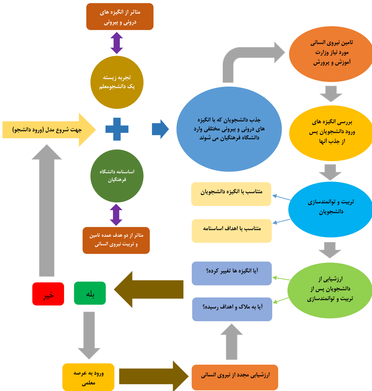
شکل ۳. مدل جذب دانشجومعلمان و تامین و تربیت نیروی انسانی آپ