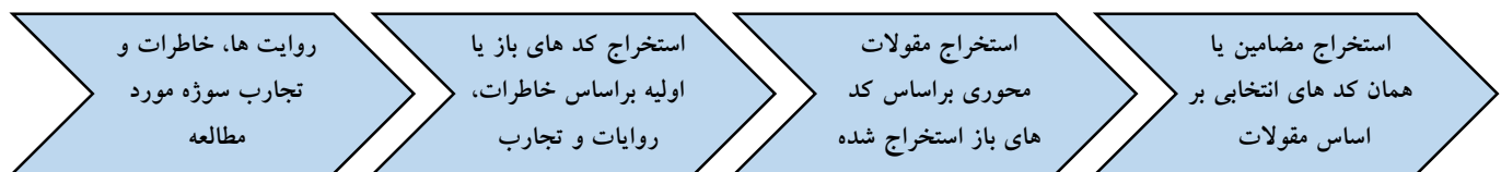
شکل ۱. مدل مفهومی فرآیند استخراج مضامین و مقولات (بر اساس روش استراوس و کوربین)

در پژوهش کنونی ما برای رسیدن به عمق ذهن و انگیزه‌های دانشجویان از مصاحبه‌های عمیق و بدون ساختار استفاده کردیم به این صورت که یکی از دانشجویان که غنی از اطلاعات مورد نیاز بود با استفاده از نمونه‌گیری هدفمند انتخاب شد و با رضایت خودش وارد فرآیند مصاحبه شد، سپس مصاحبه در محل پردیس دانشگاهی سوژه انجام گردید، دلیل انتخاب مصاحبه بدون ساختار این بود که بتوانیم از هر دری بگوییم و بحث‌های عمیق را پیش کشیده و به هسته ذهن سوژه برسیم. ما روایت‌ها، تجارب و خاطرات شخصی سوژه را به طور دقیق و عمیق مورد ملاحظه قرار دادیم و به کدگذاری آنها پرداختیم. کدگذاری‌ها مطابق با شکل ۱ و براساس روش استراوس و کوربین انجام گردید و مضامین استخراج شدند، سپس از روش تحلیل مضمون استفاده شد. گفته می‌شود یکی از راه‌های تحلیل داده‌ها در پژوهش روایی، مشخص کردن تم‌ها و عناوین اصلی است (Attaran, 2016). در این پژوهش، از روش تحلیل مضمون ۱ برای تحلیل داده‌ها استفاده گردید. روش تحلیل مضمون روشی است برای تحلیل الگوهای موجود در داده‌های کیفی به ویژه داده‌هایی که از نوع متنی هستند (Nodehi & Badri, 2022). این روش به منظور شناخت، تحلیل و گزارش الگوهای موجود در داده‌ها کاربرد‌های فراوانی دارد (Clarke & Braun, 2006).