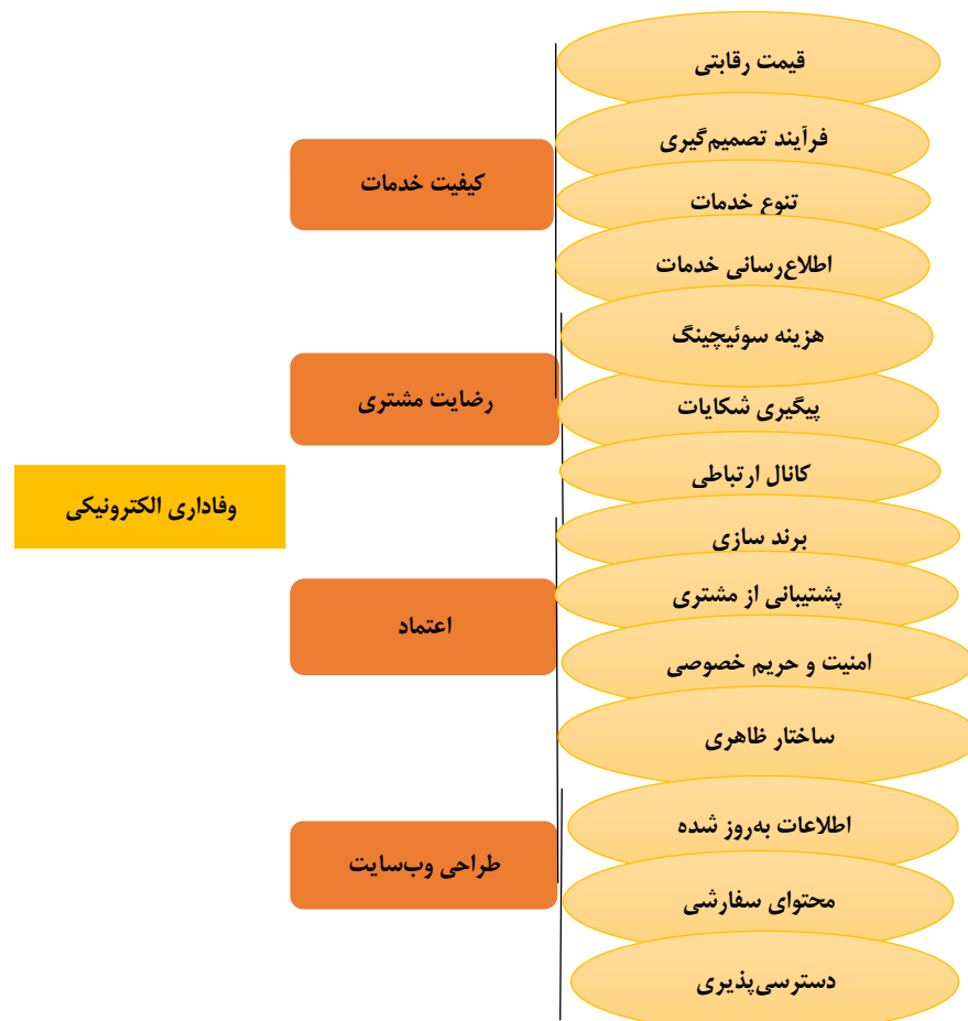
شکل شماره (۱): مدل مفهومی از فاکتورهای مؤثر بر وفاداری الکترونیکی