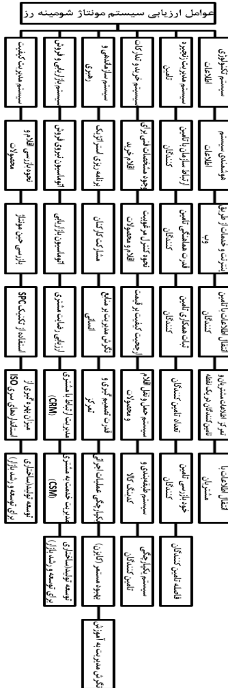
شکل شماره (۱): عوامل اصلی و فرعی ارزیابی تولید ناب