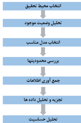
شکل شماره (۲): مراحل انجام تحقیق

در این بخش به منظور دستیابی به اهداف پژوهش و نشان دادن کاربردی بودن مدل، مراحل پیاده‌سازی مدل در یک شرکت خودرو ساز به منظور اجرای برنامه ریزی نت ماشین‌آلات تشریح می‌شود. مراحل اجرای پژوهش در مطالعه موردی در شکل ۲ نشان داده شده است.