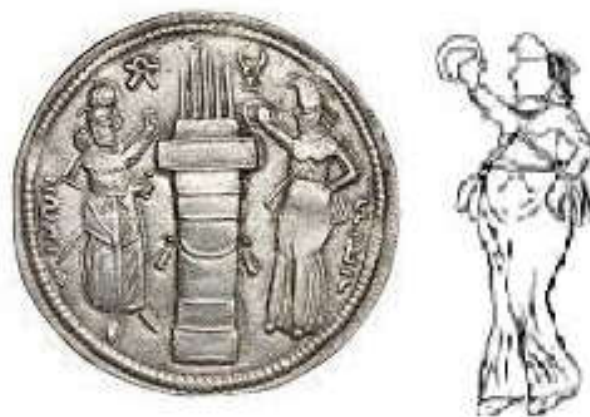
Figure 6. Coin of Bahram II with Ahanita (Avarzamani & Sarfaraz, 2015)