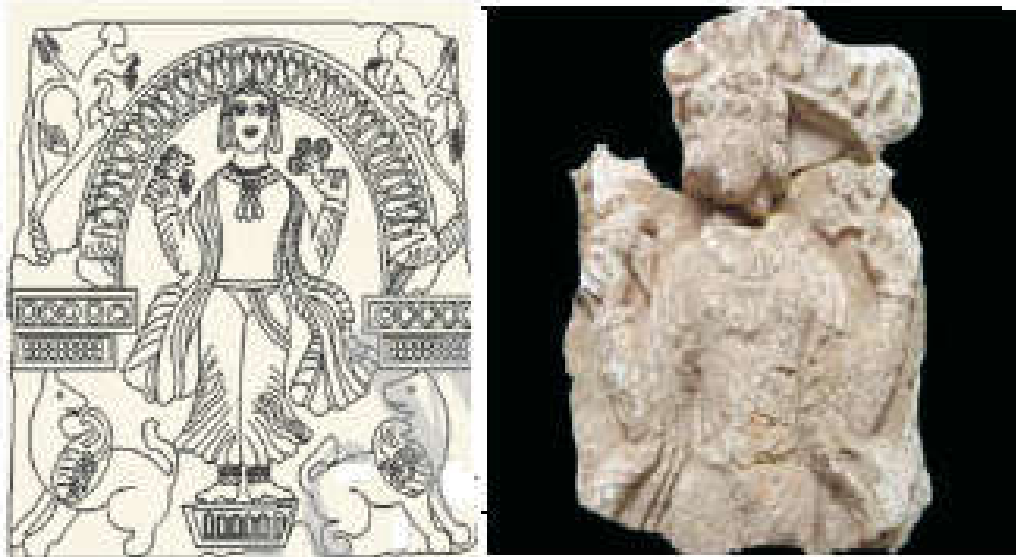
Figure 8. Sassanid molding of a Woman in Barze Qawale Archaeological Site, Kuhdasht, Lorestan (Mansoori & Karamian, 2012)