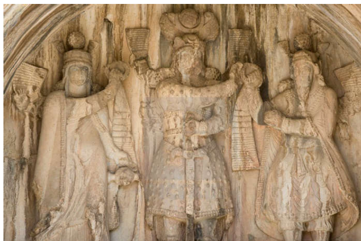
Figure 3. The relief of Khosrow II's Coronation by Anahita and Mitra in Taq-e Bostan