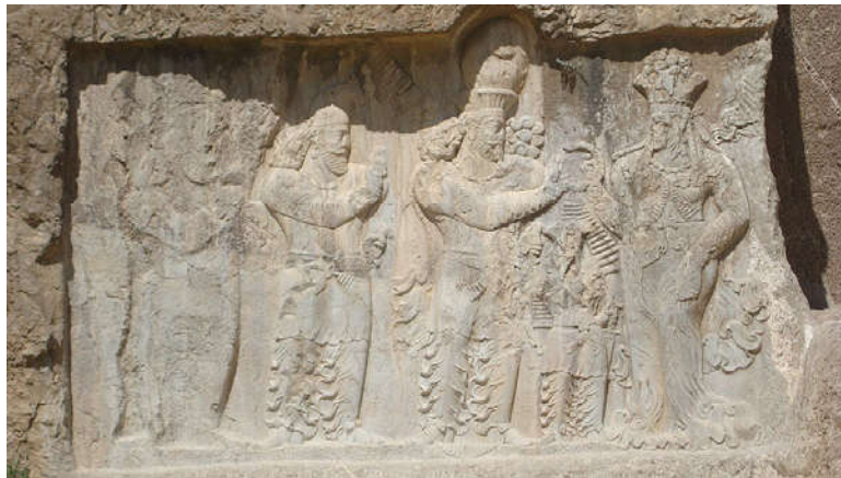
Figure 2. The relief of Narseh's Coronation by Anahita in Naqsh-e Rostam