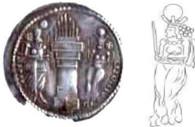
Figure 5. Coin of Artaxerxes with Ahanita (Avarzamani & Sarfaraz, 2015)