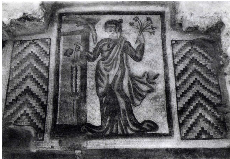
Figure 7. A woman holding a flower in a dramatic pose, Bishapur mosaics, museum of Ancient Iran (Ghirshman, 1999)

در یکی از موزاییک ها زن ساسانی بر روی دوش خود شال هایی دراز و بلندی را به صورت مورب از روی شانه راست تا پایین می انداخت و پیراهنی بلند و گشاد با آستین طراحی شده که در یکی از دست هایش تاجی از حصیر و دست دیگرش دسته گلی است. نقوش موزاییک های بیشاپور اگرچه مجریان آن ها رومی ها یا سوری های بوده اند، قطعاً جای تردید نیست که طراحی تصاویر موزاییک های بیشاپور توسط هنرمندان ایرانی - ساسانی طراحی و سپس هنرمندان رومی و یا سوری های آن ها را به موزاییک تبدیل کرده اند. این نقوش علی رغم تکنیک هنر موزاییک کاری رومی، اما تصاویر و نقش ها تماماً نشان از هنر ایرانی داشته و مطابق با خواست شاهان ایرانی ترسیم شده اند (Behraman, 2014). نقش زنان ساسانی در موزاییک های ساسانی نشان از یک نوع طرح با نام دراپه (حرکت ها یا چین های مایل پارچه بر روی بدن) برای فرم دادن به تن پوش خود استفاده می کردند. این ویژگی را در آثار متعدد ساسانی ها می توان مشاهده کرد. زنان با پیراهن های بلند و گشاد دارپه دار با آستین و بدون آستین طراحی شده اند که نشان از هنر خاص این دوره است. این نوع لباس های بلند مختص زنان اشرافی بوده است (تصویر ۷).