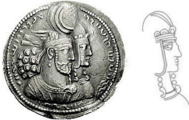
Figure 4. Coin of Bahram II with Shapurdukhtak (Avarzamani, 2014)

اهمیت بیشتری برخوردار است. هم‌چنین کمر بستن به مفهوم آماده به خدمت بودن در فرهنگ ایران جایگاه مستمر و ویژه داشته است (Sayyari, 2019). حاشیه بیرونی آستر پیکره نزدیک زمین است. نوک کلاه بی‌لبه زنانه روبان‌هایی کوچکی را حمل می‌کند، یک شنل کوتاه به‌طرز فوق‌العاده بر روی سینه با باندهایی به صورت متقاطع محکم شده است. لباس زنانه او را یک گردنبند و بازوبندی بر بالای دست کامل می‌کند. در سکه‌های ساسانی‌ها آن‌ها پوششی شبیه به ملکه نمایش داده شده است که نشان از تقدس خانواده سلطنتی دارد.