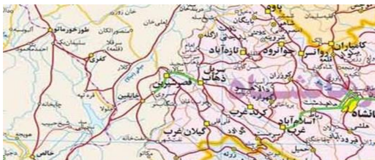
نقشه ۱: نقشه مرز قصر شیرین؛ منبع: دفتر فنی استانداری کرمانشاه

مرز قصر شیرین: منظور از مرز در تحقیق حاضر مرز کشور عزیزمان ایران با کشور همسایه عراق در محدوده شهرستان قصر شیرین می باشد که به علت موقعیت استراتژیک قصر شیرین با دولت مرکزی عراق از طریق مرز خسروی و اقلیم کردستان عراق از طریق مرز پرویزخان در ارتباط می باشد (نقشه ۱).